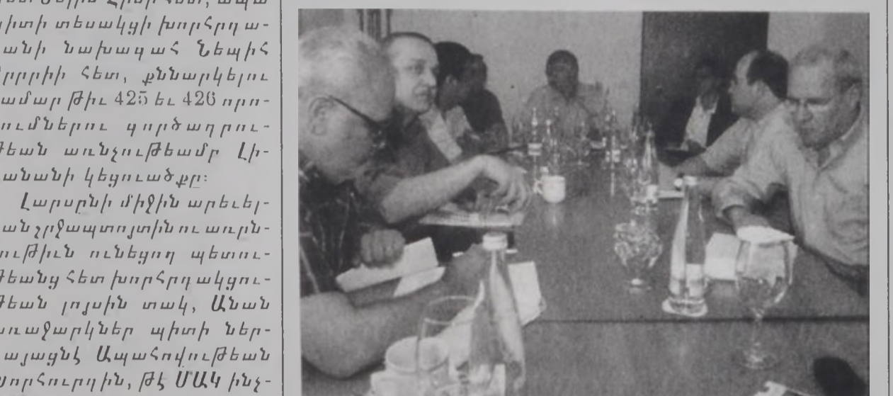
ՏԵՆԻՍ ՌՈՍԻ ԿՐ ԽՕՍԻ ԿԱՊԵՏՈՒՆԳԻ ԵՒ ԻՍՐԱՅԷԼՍԳԻ ԲԱՏԱԳՈՎԱՅՆՆԵՐՈՒՆ ԿԵՆ:

ԵՅԼԱԹ, 3 (ՌՈՑԹԼԲԸ) - Ամերիկացի յատուկ պատուիրակ Տենիս Ռոս Զորքաբաբի օր ըսաւ, որ Իսրայէլ եւ պաղեստինցիները մտադիր են յառաջիկայ երկու ամիսներուն ընթացքին թափ տալու իրենց ճիգերուն, որպէսզի կարելի ըլլայ խաղաղութեան ամբողջական ու վերջնական համաձայնագիրի մը պատկերացումը ունենայ: Ռոս, որ Երեքաբաբի օր միացած էր էլյաթի մէջ բանակցող պաղեստինցի ու իսրայէլացի պատուիրակներուն, ըսաւ, որ բանակցութիւնները նոր հանգրուան մը թեւակոխած են: Ռոս շեշտեց, որ բաւական դժուարին գործընթաց մըն է, բայց եւ այնպէս երկու կողմերն ալ լուրջ մտեցում որդեգրած են համաձայնագիրի մը հասնելու համար: Իսրայէլ եւ պաղեստինցիները սկզբունքով Փետրուար 13ին աւարտած պիտի ըլլային բանակցութիւններու կարեւոր մէկ մասը եւ պատկերացում մը գոյացուցած ամբողջական համաձայնագիրին մասին: Յիշեալ