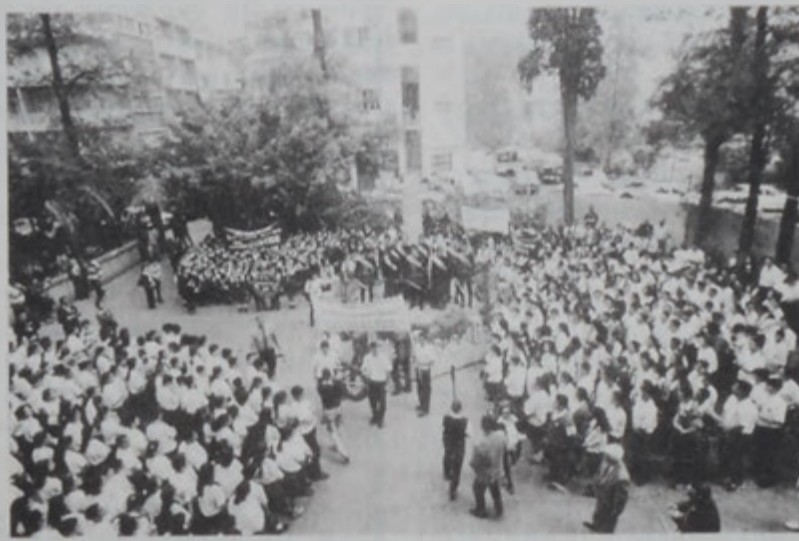
Հաւաքէն պատկեր մը

րէն եւ արարեւել խօսքարտասանեցին Մարինա Բարսեղեան (Մեսրոպեան վարժարան) եւ Լիւսի Սարգիսեան (Մ. Նուբարյանի վարժարան): Հայ կաթողիկոսական վարժարանի տնօրէնուհի Չուարթ Նաճարեան Հայերէնով փոխանցեց օրուան խորհուրդը, իսկ արարեւել Մեսրոպեան վարժարանի տնօրէնուհի Գէորգ վրդ. Եղիայեան՝ Հայ կաթողիկոսական վարժարանի խօսքը փոխանցեց վարդան եպս. Ազգարեան: