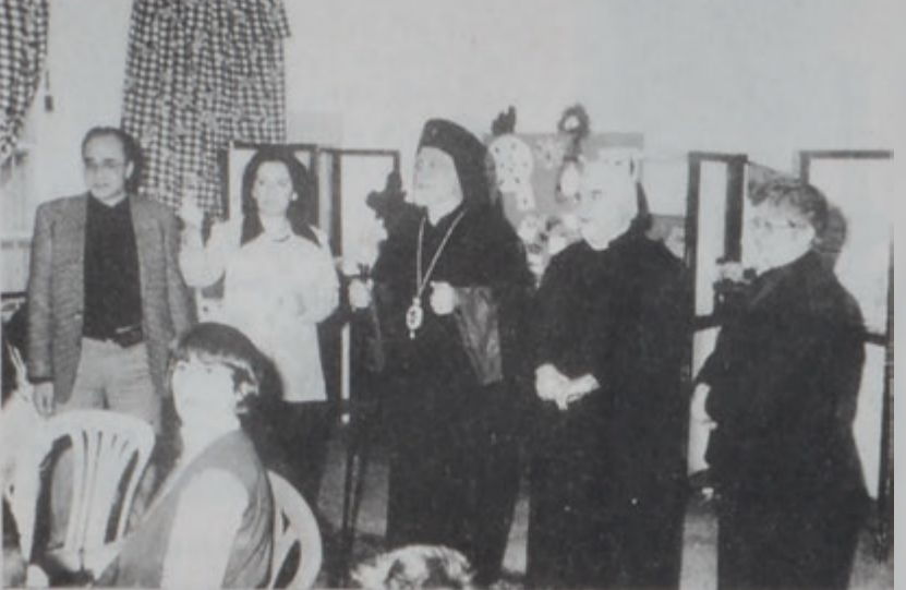
Ներսէս - Պետրոս ԺԹ. կաթողիկոս - պատրիարքը բացատրութիւններ կը լսէ կեդրոնի աշխատանքներուն մասին:

11 Ապրիլին հայ կաթողիկոս Ներսէս - Պետրոս ԺԹ. կաթողիկոս - պատրիարքը այցելեց մտքով թերած հայ մանուկներու «Ջուարթնոց» կեդրոն: Հայ կաթողիկոս հոգեւոր տիրոջ կ'ընկերանար Վարդան եպս. Աչգարեան: Վերջիններս դիմաւորուեցան «Ջուարթնոց» կեդրոնի տեսչութեան, դաստիարակներուն, պաշտօնէլու: