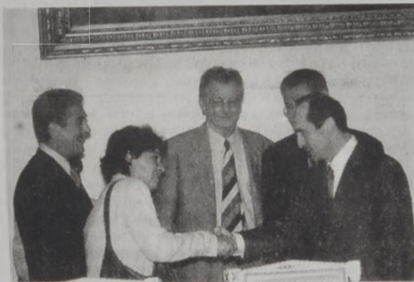
Ընդարեան կ'ընդունի Ֆրանսացի խորհրդարանականները:

Հանդիպումին քննարկուածի աւարկայ ղարձաւ Լեւոնյանի Ղարաբաղի