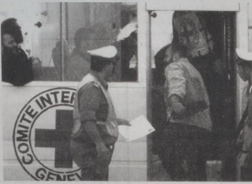
Ազատ արձակուած իրանացի արգելափակեալ մը կը բարձրանայ Միջազգային Կարմիր Խաչի թօղապարտարանը: Լոր քաղաքացիներ եւ երեսփոխաններ: Վարչապետ Սեյիմ Հըսոզլունեց 13 իրանական ցիններու ազատ արձակման ու անոնց իրենց հարազատներուն ու տուներուն վերադարձը երկարատեւ տանջանքներէ ետք: Ծար.՝ էջ 10

Իսրայելի գերագոյն ատենանի վճռումով վարչական որոշումով իրանական ցիններու արգելափակումը ապօրինի հռչակումէն ետք, Իսրայել երկէջ ազատ արձակեց նման պարագայի մէջ գտնուող 15 իրանական ցիններէն 13ը, որոնք Ալալոն բանտէն փոխադրուեցան Քէշոնի մէջ արգելափակման մը, ուր գիրքնք ստանձնեց իսրայելեան բանակը: Աւելի ուշ, Լիբանանի սահմանամերձ շրջանի մը մէջ անոնք յանձնուեցան Միջազգային կարմիր խաչին: