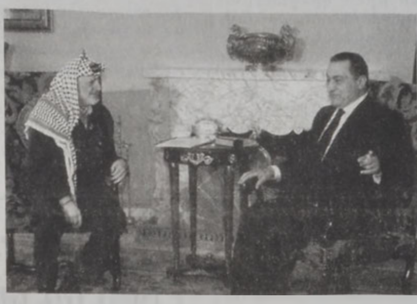
Մուպարաք կ'ընդունի Արաֆաթը Գահրիբի մէջ: ԳԱՀԻՐԷ, 19 (ՌՈՑԹԼՂ):- Պաղեստինեան իշխանութեան նախագահ Եասէր Արաֆաթ Չորեքշաբթի օր տեսակցութիւն մը ունեցաւ Եգիպտոսի նախագահ Հիւսնի Մուպարաքի հետ՝ ՄՆ հանձնարարութեամբ նախագահ Պիլ Քլինթոնի հետ իր հանդիպումէն օր մը առաջ: «Պաղեստինեան առանցքը բազմաթիւ երեսներ եւ Ծար.՝ էջ 10