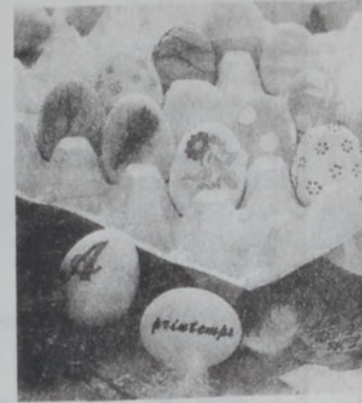
Ահաւաստիկ նոր գաղափարներ. Գործի լծուեցէ՛ք, եթէ տակաւին չէք գարդարած գետնուած ձեր հակիթները: