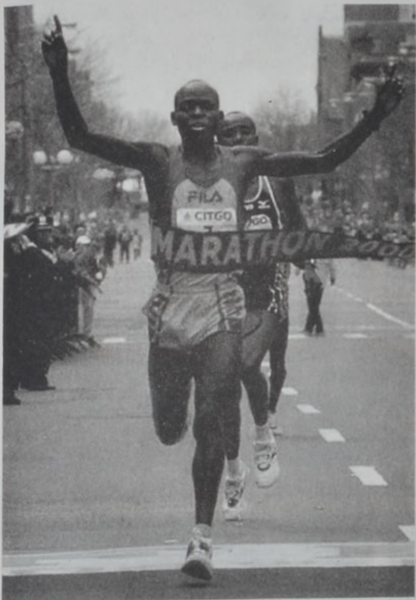
Լակաթ կը հասնի ժամանակը գիծ

Քենիացի էլիա Լակաթ շահեցաւ Պոսթընի 104րդ մա- րաթոնը, երկէ: