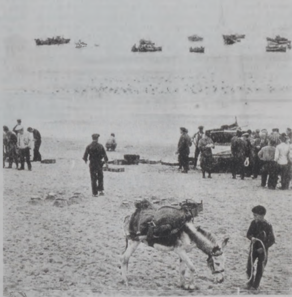
Լիզպոնի հարաւային Սեսիմպրա աւազը ձկնորսական (սարտիմ) ճարտարարուեստի կերտում:

Հայկական գաղթածայինները շարքին բաւական իրաւատու կեցած է Փորթուգալի գաղութի եւ ընդհանուր առմամբ հայ- փորթուգալական յարաբերութիւններու պարագան, այն իմաստով, որ երկու ժողովուրդները իրարու հետ կապ եւ յարաբերութիւն ունեցած են առաւելաբար օտար հողերու վրայ, եւ հետեւաբար այլ այլ յարաբերութիւնները զարգացած են բաւական հետաքրքրական պայմաններու տակ: