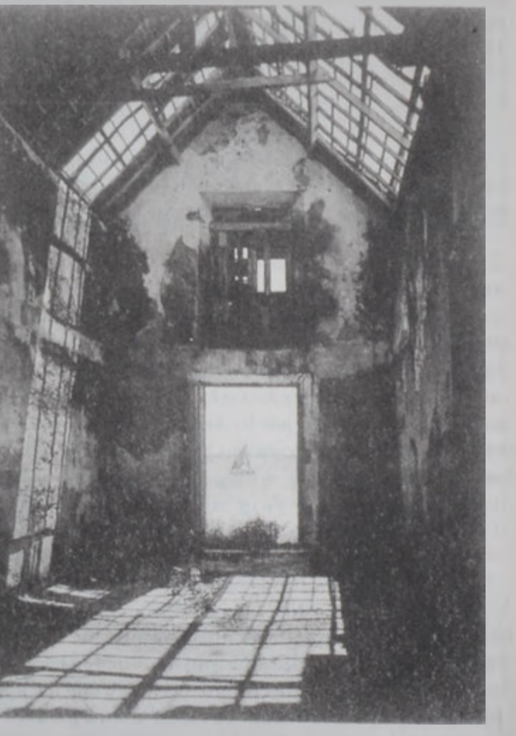
Ստրուկներու հաւաքման համար փորթուգալացիներու կառուցած բնակավայր Մոզամպիքի ծովափին:

Յիշենք, որ Յնդկաստանի եւ յարակից կղզիներու նաւանման մէջ մեծ դեր ունեցած տը Ալմէյտա ընտանիքը Պրազիլի փորթուգալացման մէջ եւս տիրական դերակատարութիւն ունեցաւ. մինչեւ հիմա ալ անոնք Փորթուգալի եւ Պրազիլի մեծ ազդեցիկ եւ ամէն շրջաններու մէջ տարած-