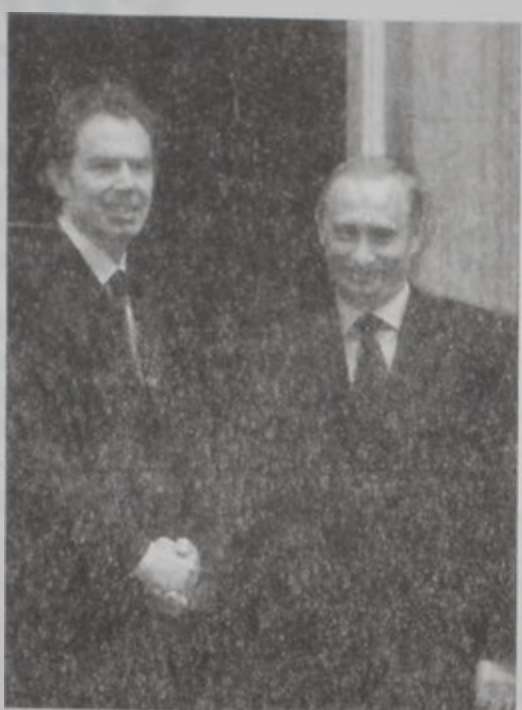
ՊԼԵՐ Կ'ԸՆԴՈՒՆԻ ՓՈՒԹԻՆԸ ԿԵՂՈՐՈՍՏԵՂԻՍ ԽՈՋԵՆԸ

կին խորհրդային երկու հանրապետութիւններուն տնտեսութիւններու վերականգնումը կենսական է միացումը գործադրութեան դնելէ առաջ: