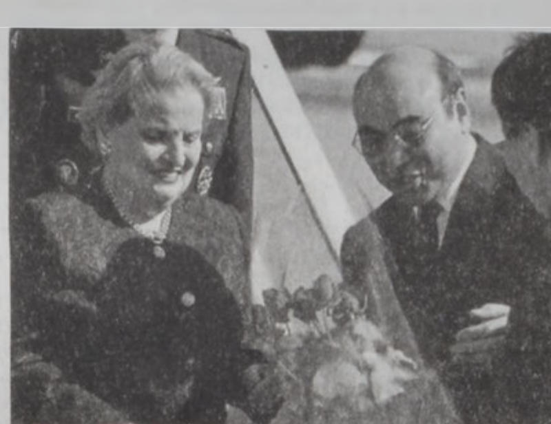
Նախագահ Աքաբե կը դիմաորէ Մատրէյն Օլիպիայը

Մ. Նահանգներու արտաքին գործոց նախարար Մատրէյն Օլիպայը երէկ Ուլպեքիստանի մէջ ուլպեք ղեկավարներուն կը ուղղեց, որ որմքաւարումներու յոյսին տակ իրենց ժողովուրդը ճշունմներու չենթարկեն: