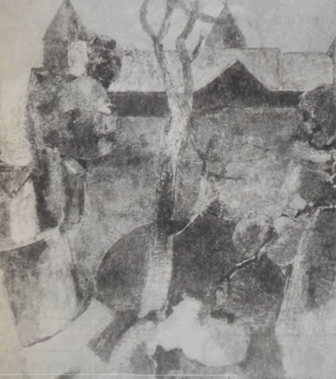
«Արեւմուտ», գործ Մինաս Աւետիսեանի

Գիշեր է: Օտարուով անցնում է երկար անձրեւափկունցի մէջ փաթաթուած մի մարդ: Երբ շուրջը ձմեռային մրսած ու խեղճ ծառեր են, կծկըւած թփեր. Բայց մարդը հրեղէն գոյներ է տեսնում, երանգների համադրութիւնը, որոնք վաղը, միւս օրը, հեցն այսօր նրա վրձնով կ'անմահանան կտաւին ու կը խելագարեցնեն դիտողին: Արդիւնէտն նա բառեր պէտք է փնտռի դրան թարգմանելու համար եւ չգտնի, երաժշտութիւն որոնի վերծանելու համար ու չկարողանայ: Լաւագոյն դէպքում կարողանայ ասել, կապոյտ հագած մայրը աշխարհին է ընծայում իր նորածին որդուն. ըն-