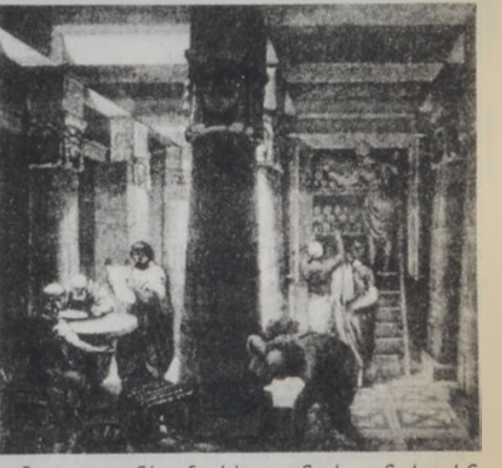
Գրադարանի «մուկեր»... ճաշ անցեալին

Աղեքսանդրիոյ հիմնադրութենէ կարճ ատեն մը ետք, Ն. Է. Յոյ դարու սկիզբը կառուցուած գրադարանը կը վարելով պտղունիներու խանդավառ գորակցութիւնը, պտղունիները մինչեւ հռոմէական արշաւանքները Եգիպտոսի վրայ իշխած