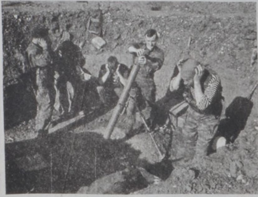
Ռուսական յարձակողականը կը շարունակուի Չեչենիոյ մէջ:

Ռուսիա երէկ գեթ խօսքով իր կեցումաձօրը մեղմացնելով յայտնեց, թէ Մոսկուա բնաւ չէ դադարած չեչենի դեկավար Ալյան Մախաաովը նկատելի դեկավար մը, որուն հետ կարելի է բանակցիլ: