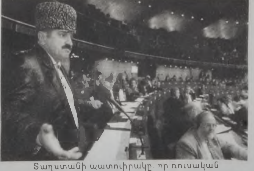
Տաղստանի պատուիրակը, որ ռուսական պատուիրակութեան մաս կը կազմէր, իր խօսքին պահուն:

Եւրոպայի խորհուրդը երկէ որոշեց առկախել Ռուսիոյ անդամակցութիւնը, ինչպէս նաեւ արագ քայլերու դիմել Չեչենիոյ մէջ իր մարդկային իրաւանց մարզի բարելաւելու համար: