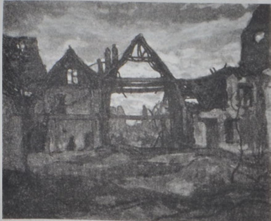
«Ուայփորդի տուները». Ա. Ճեքսը (1917)