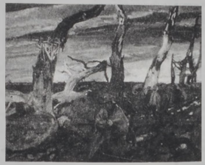
«Չեմ ուզեր նկարել պայծառ բաներ. այլ կոտորուած եւ փշրուած պատկերներ», Րոսա է Ճեքսը:

Սակայն հակառակ սկզբնական շրջանի խանդավառութեան, պատերազմի քանատական սրբապատկերները: