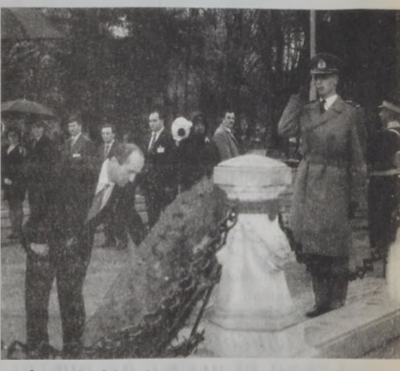
Քոչարեան ծաղկեպսակ կը գտնուէ Աճառօք Զինուորի յուշակոթողին վրայ:

Նախագահ Ռոպէրթ Քոչարեան, որ պաշտօնական այցելութեամբ Ռումանիա կը գտնուի, երկէ նախագահ Ըմիլ Բոնսարսթիսեպուի հետ ստորագրեց միացեալ յայտարարութիւն մը, կատարուած բանակցութիւններուն վերաբերեալ: