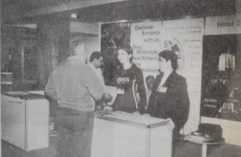
Հայկական տաղաւարի ներկայացուցիչները տեղեկութիւններ կը փոխանցեն: