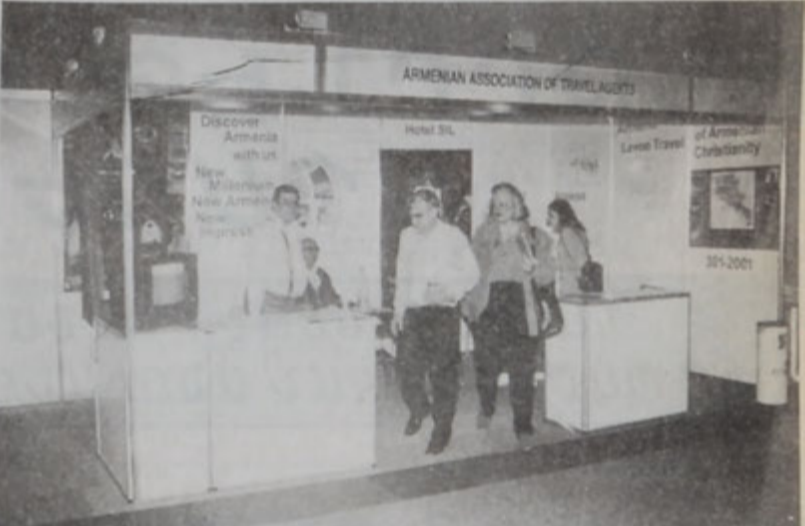
Հայկական Ճամբորդական Գործակալութեանց Կազմակերպութեան տաղաւարի այցելուները:

Լիբանանահայ գաղութի մասին խօսելով՝ ան գնահատեց լիբանանահայութիւնը, որ յարգուած է բոլոր լիբանանցիներէն ու միշտ հայրենիքի բարգաւաճումը