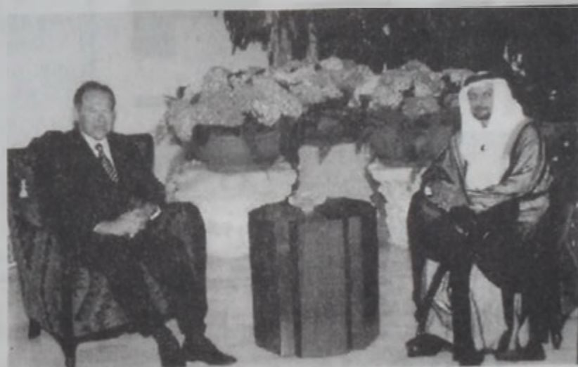
Լահուտ կ'ընդունի շէջի Ֆահմի

Քասիմ, իր կարգին, ըստ, որ նախագահ Լահուտի փոխանցած է Ա. Մ. Էմիրութեանց ղեկավար շէջի Ֆահմ Պրն Սուլթանի ուղիղ յայտններն ու հաւատարմութիւնը, ինչպէս նաեւ նախագահի կողմէն կատարուած ամբողջական քննարկումը: