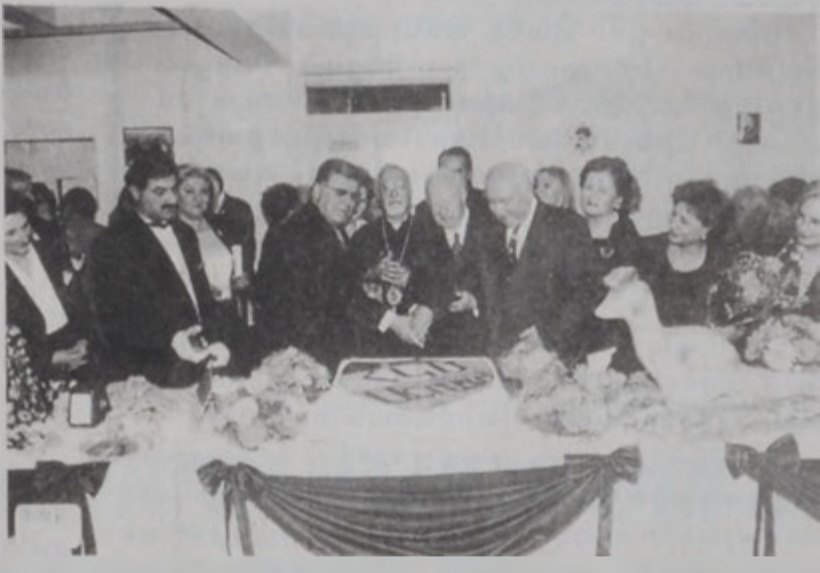
Մեծարեալները հիւրասիրութեան պահուն:

Հանդիսութեան աւարտին ներկաները ուղղուեցան Հ. Կ. Մ. ի ակումբին սրահը, ուր տեղի ունեցաւ հիւրասիրութիւն: