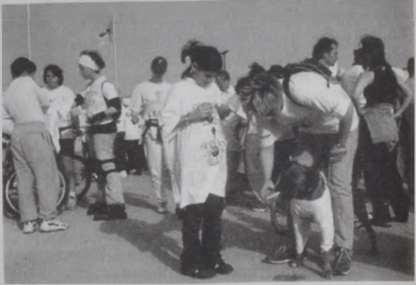
Երեկ կայացաւ Թերի Ֆոքս վագրը, որուն հասոյթը պիտի յատկացուի քաղցկեղի հետազոտութեան:

Պետական պատկերասփռուած կայանը ծախելու ծրագրի մը գոյութեան մասին՝ Ապու Ռոզգ ըսաւ, որ նման հարց չէ քննարկուած: Ան մաղթեց, որ արմատական լուծումներ կը տրուին Թեյէ Լիպանի բոլոր հարցերուն: