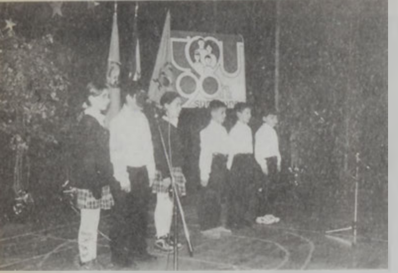
Ազգ. Զառուհից Մանկանց վարժարանի աշակերտները