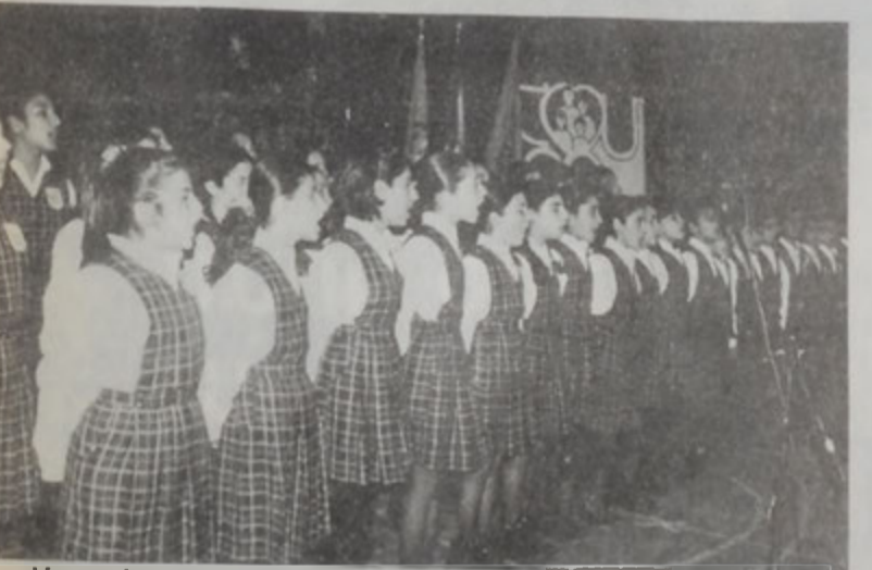
Ազգ. Եղիշէ Մանուկեան վարժարանի երգչախումբը

տասնութեամբ երկու ունեցան հայկական վարժարաններու աշակերտները, որոնք արժանացան ներկաներուն ջերմ գնահատանքին: