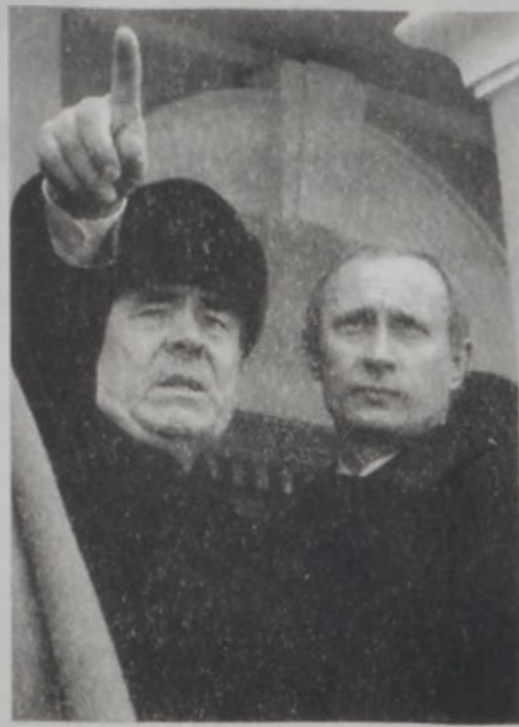
Փութինը թափարտանի դեկավարին հետ

Թափարտան Մոսկուայէ մեծ ինքնավարութիւն ապահոված է, սակայն անկախ անկախութեան պահանջով Չեչենիոյ օրինակին չէ հետեւած: Ըստ ռուսական լրատու գործակալութիւններու, Փուտինը ըսած է, թէ թափարտանի մէջ Շոյմիլի քաղաքականութեան կը հիանայ: