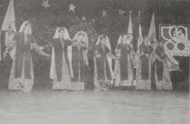
Կարողիկէ Հոփոսիմեանց վարժարանի աշակերտները