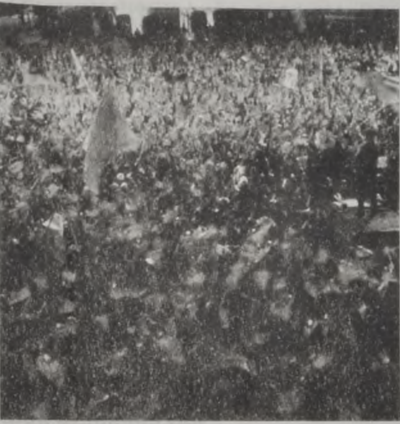
Յոյցէն տեսարան մը

Ճափոնի արտաքին գործոց նախարարութիւնը, իր կարգին, յոյս