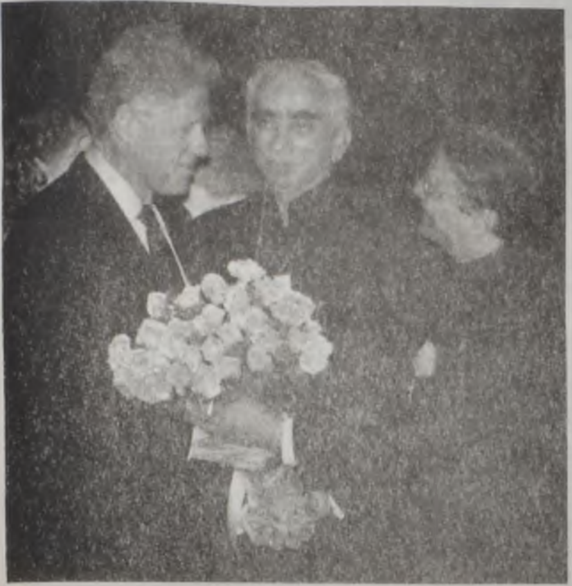
Քլինթոնը կ'ընդունուի Հնդկաստանի վարչապետին կողմէ

Միացեալ Նահանգներու նախագահ Պիլ Քլինթոնը երէկ Հնդկաստան հասաւ, վեցօրեայ շրջապտոյտի մը համար՝ դէպի հարաւային ասիական երկիրներ: Քլինթոնը կը յուսայ մեղմացնել յարաբերութիւնը Հնդկաստանի եւ Փաքիստանի միջեւ: