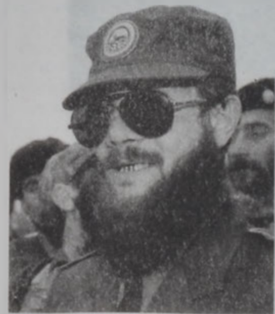
Ընթացող չեչեններու ազատարարութեան ընթացքին Ռատուել՝ 1998ին:

Ռուսական ապահովական ուժեր ձերբակալեցին չեչեններու ղեկավարներէն Ռատուելը եւ զայն առաջնորդեցին Մոսկուա, դատուելու համար: Ռատուել ծանօթ է ռուս պատանդներ վերցնելու իր արարքներով, որոնք սարսափեցուցած էին ռուսերը Չեչենիոյ առաջին պատերազմին ընթացքին, 1994էն 1996: