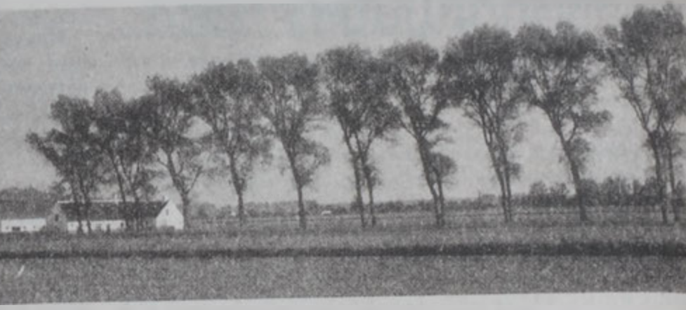
Ֆլանտրիական ցածրադիր ծովագերայ ագարակներ Հոլանտայի սահմանամերձ շրջանին մէջ

Միջին կամ կեդրոնական պելճիքան կառային բուրգերէ կազմուած շրջան մըն է եւ կ'ընդգրկէ երկրին ամէնէն իստ բնակչութեան կազմին մէջ մտաւ: Թ. դարուն կազմուեցան Ֆլանտրիայի, Հենոյի, Նամուրի եւ Լիքսեմպուրկի կոմսութիւնները, Պրայանի եւ Լիմպուրկի դքսութիւնը, Լիեժիեյիսկոպոսական իշխանութիւնը եւ Սքաւելոթ-Մալմետիի արքայութեան իշխանութիւնը: