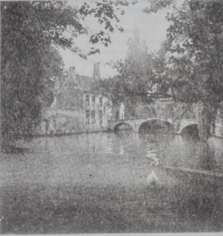
Պրիւժ քաղաքը, նշանաւոր իր ջրանցքներով

Անվերսի մէջ կեդրոնացաւ: Պելճիքահաստատուած հայ ուսանողներ 1965ին Պրիւքսէլի մէջ հիմնեցին Հայ Ուսանողներու Ընկերութիւնը, որ բաւական աշխուժացուց համայնքային կեանքը: