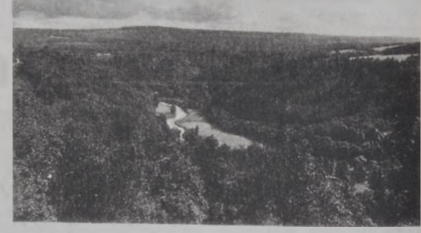
Արտեմներու անտառապատ շրջանը

Նաչակրական առաջին արշաւանքը յայտարարեց Արքանոս Բ. պապը, 1095ին, Քլեմէնտի համաժողովէն ետք: Սերկը երկրի տարածքին մէջ կը բնակուէր: Պելճիքայի միացումէն յետոյ, Սերկը երկրի տարածքին մէջ կը բնակուէր: Պելճիքայի միացումէն յետոյ, Սերկը երկրի տարածքին մէջ կը բնակուէր: