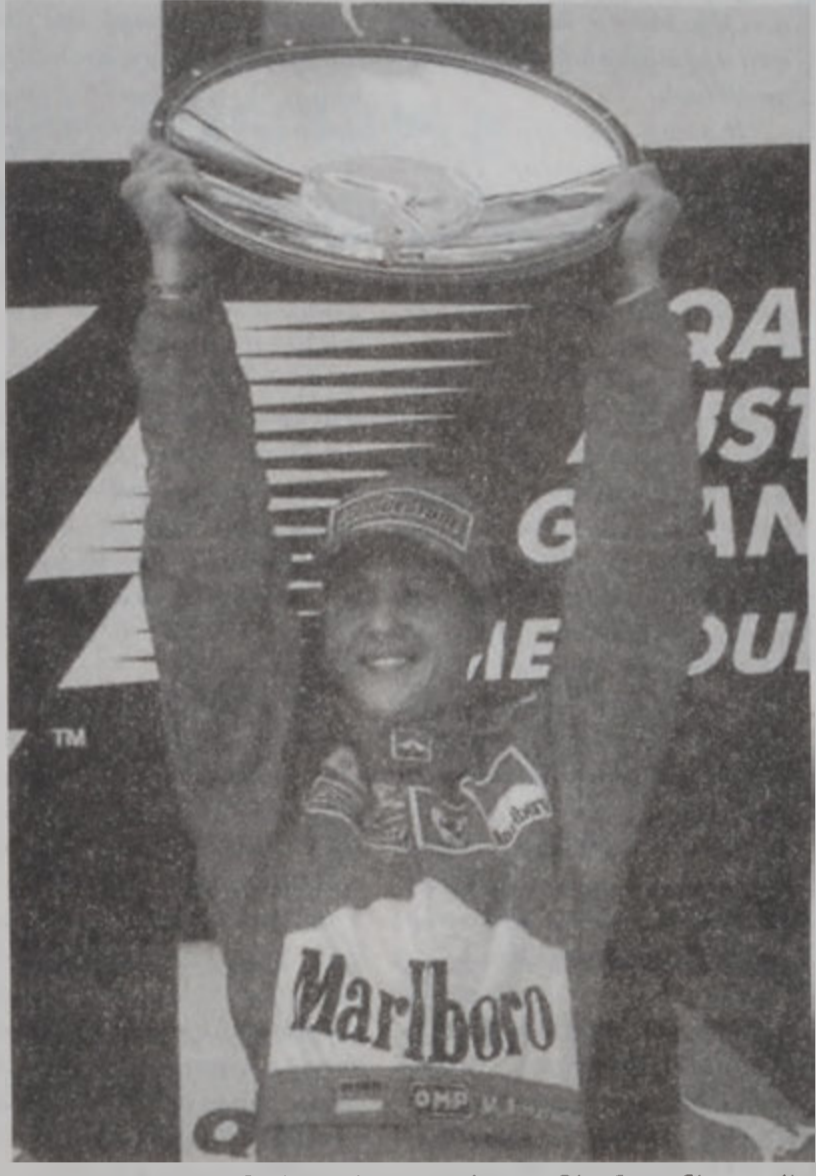
Միքայել Շումպլըրը կը բարձրացնէ Ֆորմիլա 1ի 21րդ դարու առաջին բաժակը...

Ֆորմիլա Մի երրորդ հապարտակաճական պարտութեան մատնեց Տենարիի հարիւր տուկոս տիրապետութեամբ: Արդարեւ, 2000ի աշխարհի ախոյեանութեան Ա. հանգրուանը, որ տեղի ունեցաւ Երէկ՝ Մելպուռնի (Աւստրալիա) մէջ, աւարտեցաւ գերմանացի Միքայել Շումպլըրի յաղթանակով: Երկրորդ հանդիսացաւ անոր խմբակիցը՝ պրապիլցի Ռուպէնս Պարիթելլօ, իսկ երրորդ՝ Միքայելի կրտսեր եղբայրը՝ Ռալֆ Շումպլըրը (Ուիլիամ):