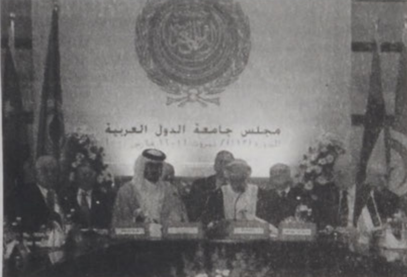
Արաք արտաքին գործոց նախարարներու ժողովին բացումը:

Արաք արտաքին գործոց նախարարներու Պէյրութի ժողովը Շաբաթ օր անվերապա՛ գորակցութիւն յայտնեց Լիբանանին: Արաքական Լիբանանի նախարարական խորհուրդի 113րդ ժողովը գումարուեցաւ Պէյրութի մէջ, Շաբաթ օր: Անոր բացման նիստը եղաւ Հրապարակային եւ պատկերասփռուեցաւ ուղղակիորէն: 112րդ նստաշրջանի նախագահը՝ Իրաքի արտաքին գործոց նախարար Մուհամմա՛ Սալիտ Սահահֆ նըստաշրջանի նախագահութիւնը Օմանի յանձնելէ առաջ արտասանած իր խօսքին մէջ նկատել տուաւ, որ որեւէ ինքնուրուի կողմէն իր անվերապա գորակցութիւնը յայտնեց իր անվերապա գորակցութիւնը յայտնելու նպատակով: