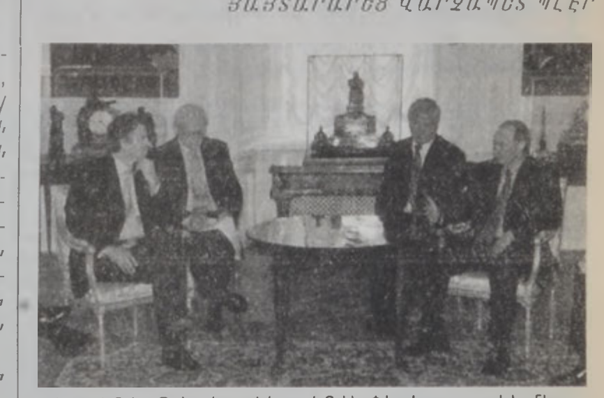
Փութին եւ Պէր կը զեկուցեն Ս. Փեթրոսպոլի մէջ տեղի ունեցած իրենց հանդիպումին ընթացքին:

Բրիտանիոյ վարչապետ Թոնի Պէր Ռուտայ իր այլ-ցեղութեան աւարտին գովասանքով արտայայտուեցաւ նախագահի պաշտօնակատար Վլասիմիր Փութինի մասին՝ զայն նկատելով իբրեւ «տուրքուրու ձգող» մարդ մը, որ յստակ տեսլական մը ունի իր երկրին ապագային մասին: Պէր. Շաբաթ իրիկուն Լոնտոն վերադարձի ճամբուն վրայ, օդանաւին մէջ Քլիֆֆինցեթրու յայտնեց, թէ Փութին «բաւական արագ սորվող» անձ մըն է, «չստիճեցի եւ յստակ տեսլակտով մը, ինչ կը վերաբերի այն բաներուն, զորս կ'ուզէ իրագործել Ռուսիոյ մէջ»: