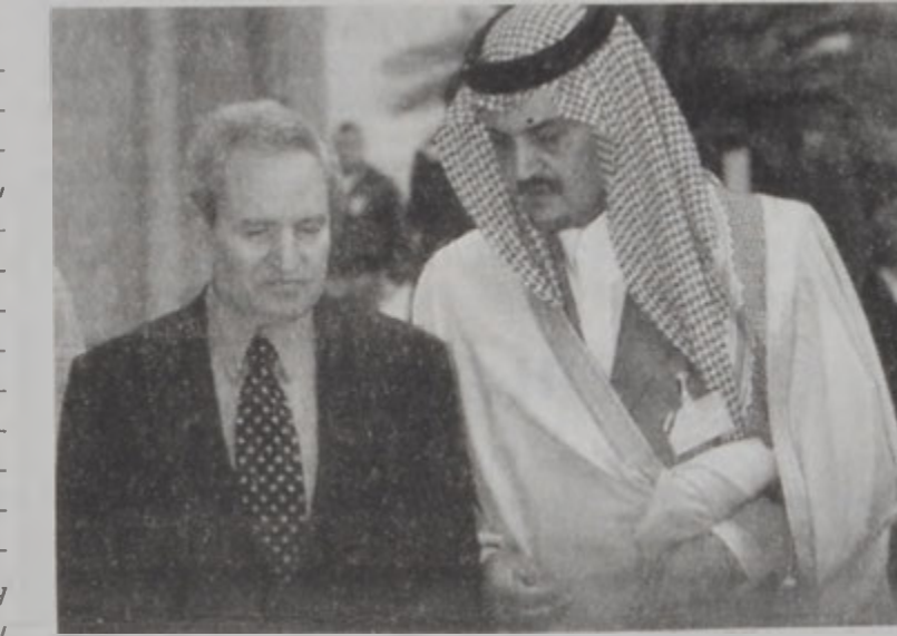
Սէուտական Արաքիոյ արտաքին գործոց նախարար Սէուտ Ֆայսալ կը զեկուցէ նախարար Ծարէհի հետ:

որոն: Վարչապետը ժողովին ներկայացուց Լիբանանի քաղաքայիններուն ու քաղաքային կառուցներուն ուղղուած եւ «Հիթլերեան» ոճով կատարուած խորանջլեան վայրագութիւններն ու սպառնալիքները: Այս կայացութեան ղեկավար, Լիբանանի կառավարչական Ապրիլեան Հասկացողութեան, իսկ իսրայելեան Հասկացողական քաղաքականութեան արդիւնք պիտի չտայ, այլ աննախատեսելի անդրադարձներ պիտի ունենայ խաղաղութեան ուղղութեամբ: