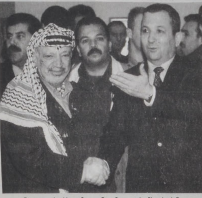
Պարաշ եւ Արաֆատ Ռամալայի մէջ իրենց հանդիպումին ընթացքին:

ՊԱԿ եւ Իսրայէլ համաձայնեցան այս ամսուան ընթացքին վերսկսել իսրայէլեան բանակցութիւններուն, յայտնեց ամբողջապէս յատուկ պատուիրակ Տենիս Ռոս: Ռոս կը խօսէր Ռամալայի մէջ, ուր անցնող քսանչորս ժամուան ընթացքին երկրորդ անգամ ըլլալով հանդիպում ունեցած էին պաղեստինեան իշխանութեան նախագահ Նասրալլա Արաֆատ եւ Իսրայէլի վարչապետ Եհուդա Պարաշ: Երկրորդ հանդիպումին աւարտին, Ռոս ըսաւ, որ երկու կողմերը լաւապէս քննարկեցին կացութիւնը եւ համաձայնեցան թափ տալ բանակցութիւններուն, որպէսզի կարելի ըլլայ յարգել 13 Սեպտեմբերի ժամկէտը, երբ պէտք է աւարտած ըլլան վերջնական իրավիճակի բանակցութիւնները եւ իսրայէլեան ամբողջական համաձայնագիր մը ստորագրուի: Ռոս աւելցուց, որ Պարաշ եւ Արաֆատ որոշեցին Ատհալի տունէն ետք Ուաշինկթընի մէջ վերսկսել: