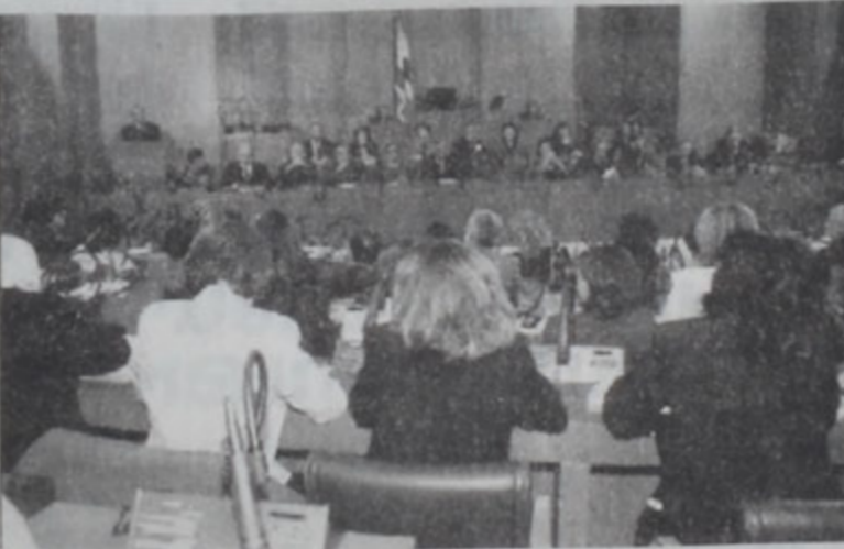
Արաբ խորհրդարանական կոնֆերանսի համագումարին բացումը:

Խորհրդարանի նախագահ Նեպի Պրրի երէկ հաւաստեց, որ Լիբանանի Իսրայէլի պահակ պիտի չդառնայ հանդուս յայտնելով, որ իսրայէլեան ուժերու հեռացումը որոշումը մարտավարական նկատառումներով ետքայլ մըն է միայն: Պրրի կոչ ուղղեց դէմ դնելու իսրայէլեան խուսանաւումներուն, մանաւանդ Լիբանանէ միակողմանի կերպով քաշուելու յայտարարութեան լոյսին տակ: Արաբ խորհրդարանական կոնֆերանսներու խորհրդարանին մէջ տեղի ունեցած հանդիպումին քաջամար իր խօսքին մէջ Պրրի ըսաւ. «Ճիշդ չեն այն կարծիքները, թէ Իսրայէլ կ'ուզէ քաշուիլ Լիբանանէն եւ իբրանացիներն են այդ հեռացումը մերժողը. հակառակը, մենք փորձառութեամբ գիտենք, թէ ինչ են Իսրայէլի յետին նպատակները. եւ ՄԱԿ-ի 425 որոշումի գործարարութեան տարբեր շրջագիծի մէջ