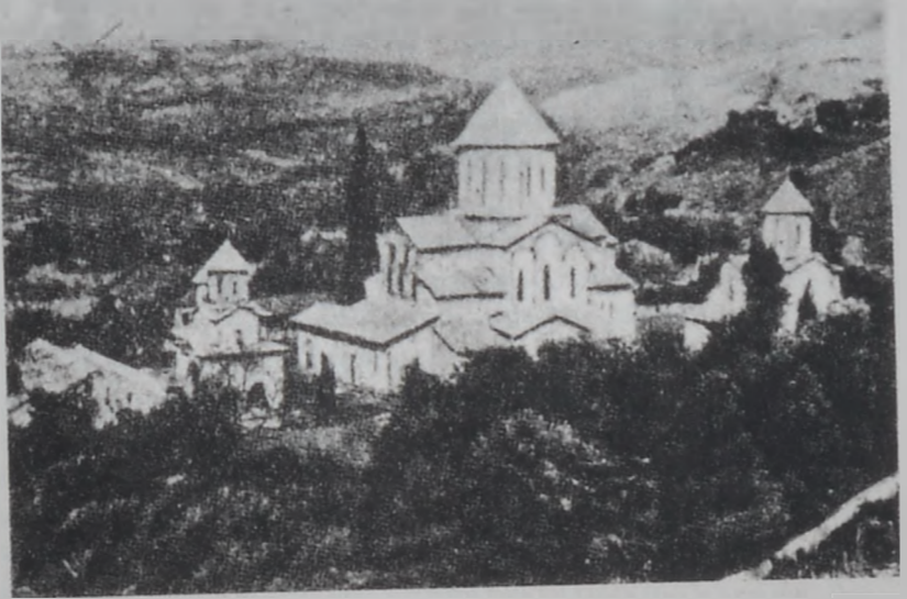
Վրացական Գելաթի վանքը, կառուցուած՝ ԺԲ. դարուն

Հիւսիսային առեւտրական ճանապարհներուն վրայ գտնուելով՝ Լոռի արագօրէն զարգացաւ, բարգաւաճեցաւ եւ առեւտրական ու արհեստներու կարեւոր կեդրոն դարձաւ: Անկիւ առեւտրական ճանապարհներով կապուեցաւ Անիի, Դուրիի, Դամասիսի, Տփղիսի եւ Վրաստանի տարբեր քաղաքներու հետ: