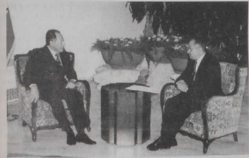
Նախագահ Լահուտ կ'ընդունի Իրանի արտաքին գործոց նախարարի օգնականը

Իրանի արտաքին գործոց նախարարի Միջին Արևելքի և Հյուսիսային Աֆրիկայի հարցերու օգնական Մոհամեդ Ռիտա Սաուդը, հանրապետության նախագահ Լահուտի յանձնեց անոր իրանցի պաշտօնակից Մոհամեդ Խաթեմիին նամակ մը, որ կը վերահաստատէ թէ Իրան կը կանգնի Լիբանանի կողքին: