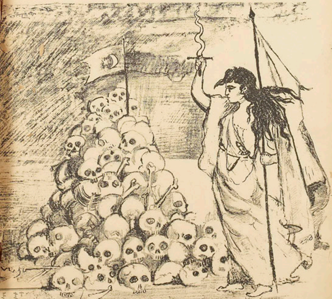
Այս քան ժամկետի միջոցով ժամկետի կտրվում է ժամկետի Տարեկանը