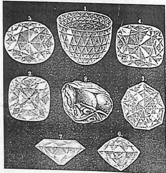
Գարիել Մելեւիշեանի «Հանքաբանութիւն» գրքից երեք պատկեր

Գ. Յ. Տէր-Յովհաննեսը դեռեւս 1881 թ. ամբողջութեամբ հրապարակել է 1693 թ. շարագրուած շրջաբերականը, առանց որեւէ քննութեան՝ «յաղագս լինելոյ ազգային հնութեան, թէպէտ արտաքոյ կարգի պատմութեանս է գործ» 3 : Սակայն, այս արժէքաւոր վաւերագիրը հետագայում մատնուել է անուշադրութեան ու որեւէ քննութեան չի արժանացել 4 : Այդ իսկ պատճառով, կրկին վերահրատարակելով այն, սողատակում նշանակում ենք Տէր-Յովհաննեսի շեղումներն ու