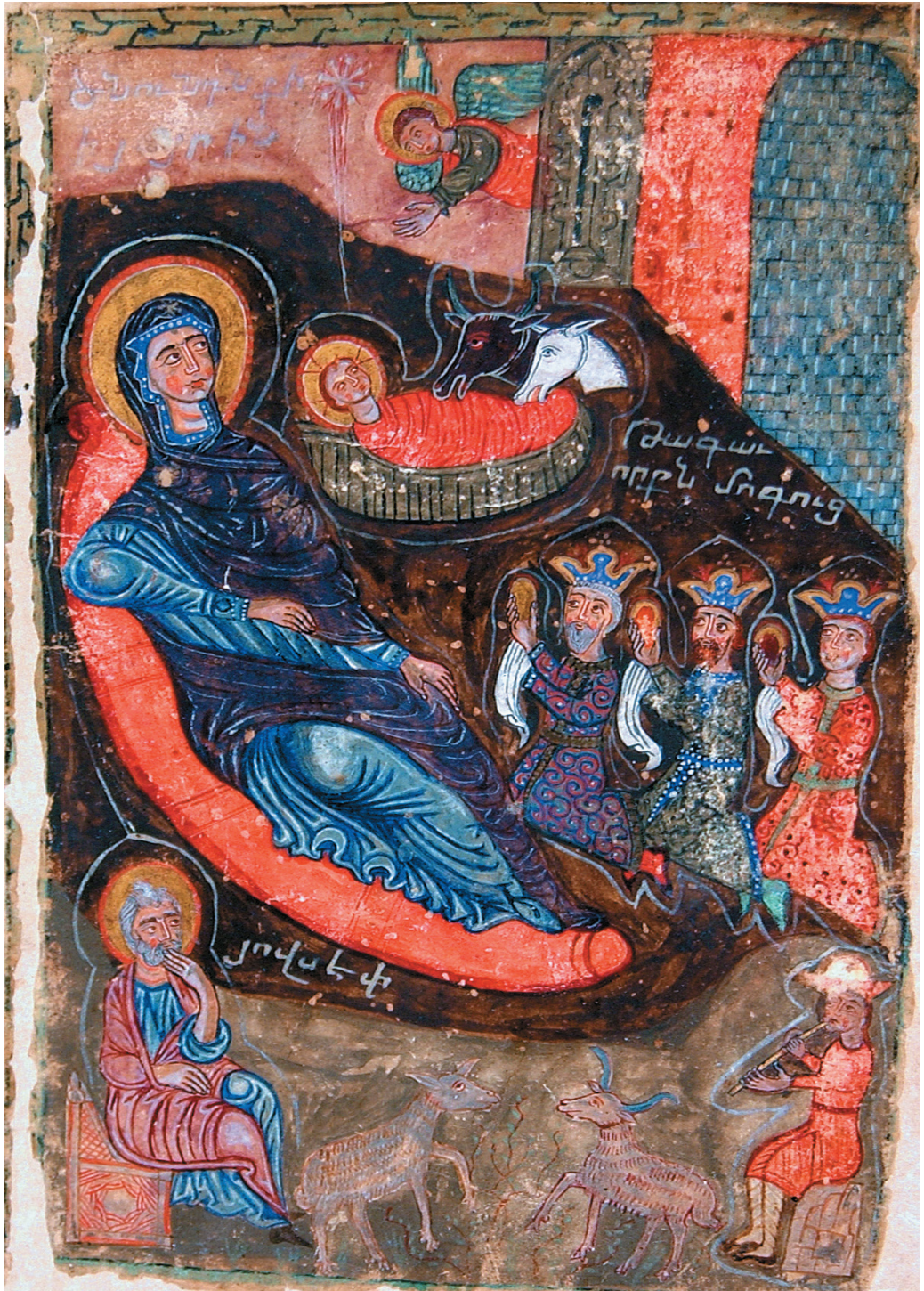
ՔՐԻՍՏՈՍ ԾՆԱԻ ԵՒ ՅԱՅՏՆԵՑԱԻ, ՋԵՁ ԵՒ ՄԵՁ ՄԵԾ ԱԻՆՏԻՍ