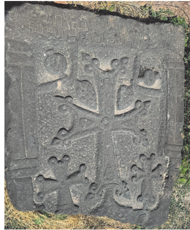
Խաչքար, 1218 թ.: