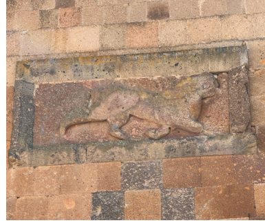
Բագրատունյաց զինանշանը Սմբատաշեն պարիսպների վրա, Ավագ դղան մոտ, առանց խաչի պատկերի: