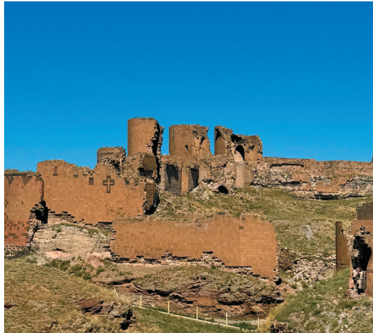
Անիի պաշտպանական կառույցների վրա կիրառված խաչազարդեր: