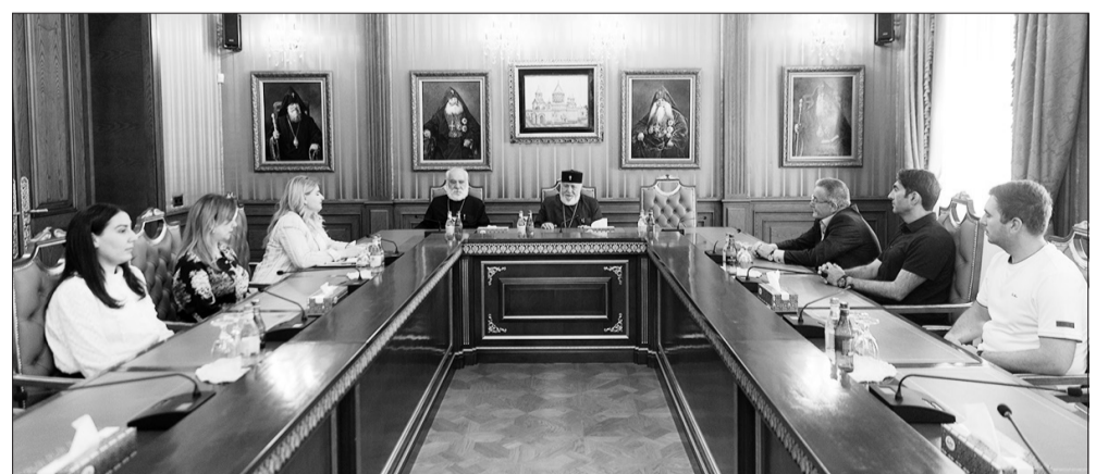
Հունիսի 5-ին «Մարդու իրավունքների և Ֆեդասպանագիտության կենտրոն» ՀԿ-ի ներկայացուցիչներին

Ամենայն Հայոց Կաթողիկոսն ընդունեց «Մարդու իրավունքների և Ֆեդասպանագիտության կենտրոն» հասարակական կազմակերպության ներկայացուցիչներին: