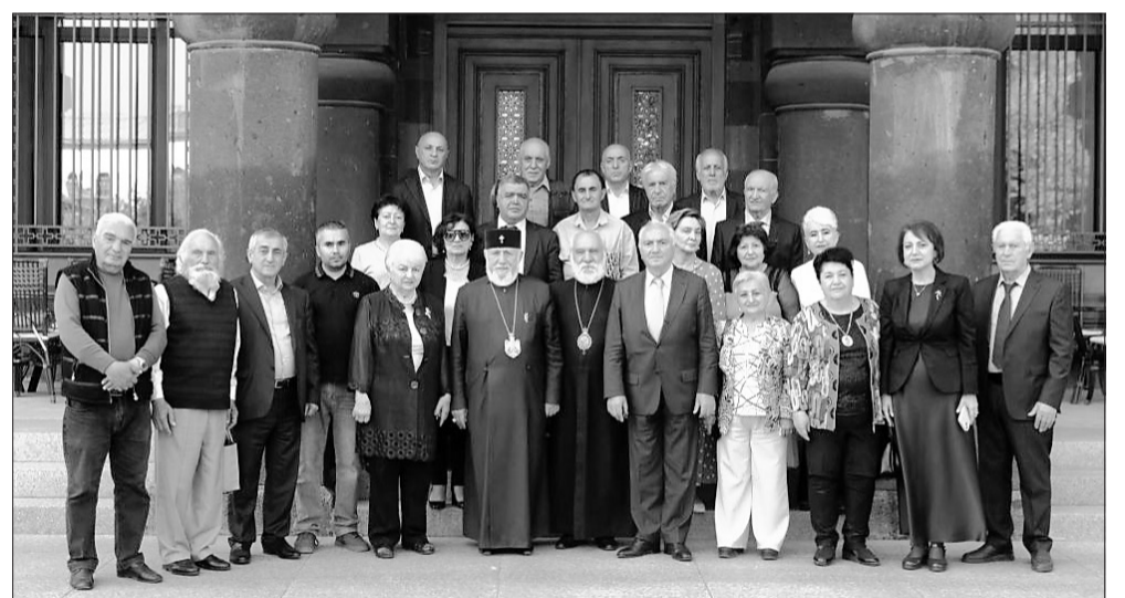
րի առջև ծառայած հիմնախնդիրներին, նրանց հոգևոր խնամքին և սոցիալական կարիքներին, ինչպես նաև արցախահայության արդար իրավունքների և Արցախի հոգևոր-մշակութային ժառանգության պաշտպանության առնչվող հարցերին:

Հանդիպման անդրադարձ կատարվեց բռնի տեղահանված արցախահայե-