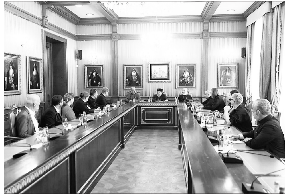
Կազմակերպության պատվիրակությանը՝ գլխավորությամբ Գերմանիայի եպիսկոպոսաց համաժողովի Բարեգործական հարցերի հանձնաժողովի նախագահ, Ֆրայբուրգի արքեպիսկոպոս Շտեֆան Բուրգերի: Լրատվական նյութերը՝ Մայր Աթոռ Սուրբ Էջմիածնի տեղեկատվական համակարգի

խի հոգևոր-մշակութային ժառանգության նկատմամբ շարունակվող ոտնձգությունների մասին: Ընդգծվեց, որ տեղի ունեցածը հայ ժողովրդի դեմ իրականացված հերթական ցեղասպան գործողությունն է, ինչը վկայում է, որ մարդկության դեմ ոճրագործությունների անպատժելիությունն ու դրանց ոչ համարժեք դատապարտումը շարունակում են ծնել նոր ողբերգություններ: Զրույցի ընթացքում քննարկվեց նաև ցեղասպանագիտության ոլորտում կրթական նախաձեռնություններին հոգևորականների մասնագիտական ներգրավվածության մասին: