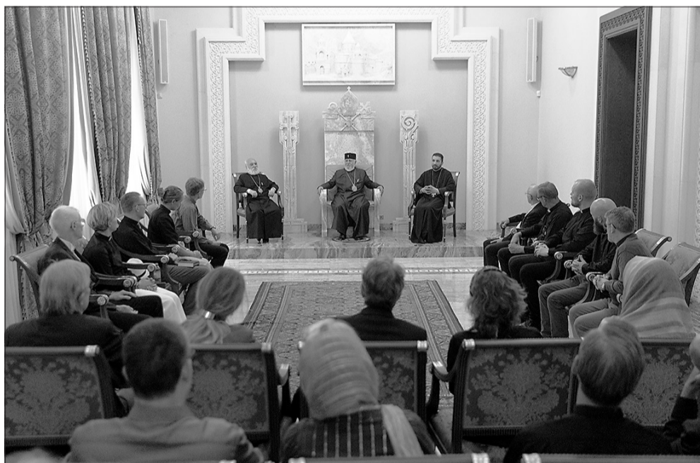
Հունիսի 2-ին Պանիայի Ավետարանական Լյութերական Եկեղեցու ուխտավորներին

Ն. Ս. Օ. Տ. Տ. Գարեգին Երկրորդ Ծայրագույն Պատրիարք և Ամենայն Հայոց Կաթողիկոսն ընդունեց Պանիայի Ավետարանական Լյութերական Եկեղեցու շուրջ 30 հոգևորականների և ուխտավորների: