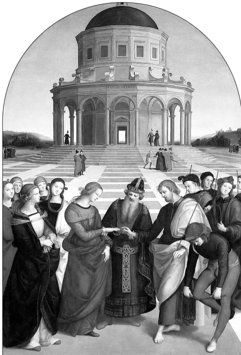
Ռաֆայել Սանտի. Կոյս Մարիամի նշանադրութիւնը, 1504 թ.

Պսակը արդար զուգակցութիւնն է ամուսնացածներուն՝ արուին եւ էգին՝ անբաժանելի կապակցութիւնն է կենցաղավարութիւնն ունենալով: Արդ, արդար զուգակցութիւնն ըսելով, կը զանազանէ Սուրբ Պսակը շնութենէն, պոռնկութենէն եւ ազգապղծութենէն, որ արդար զուգակցութիւնն չեն, այլ պիղծ ու անմաքուր խառնակութիւնն: Արուին եւ էգին ըսելով՝ Սուրբ Պսակը կը բաժնէ արուամուկութենէն, որ չլսուած չարիք է: Եւ ըսելով, թէ անբաժանելի կենցաղավարութիւնն ունենալով՝ աստուածային վճիռը կը հաստատէ, թէ՛ երկուքը մէկ մարմին թող ըլլան, որ Քրիստոս վճռեց՝ ըսելով, թէ՛ Աստուծոյ միացուցածը մարդը թող չբաժնէ [տես Մատթ. 19.6]: որովհետեւ այս խորհուրդն օրինակն ու գաղափարն է Քրիստոսի Եկեղեցոյ եւ մարդկային բնութեան հետ միաւորութեան: Տակաւին՝ Քրիստոս Եկեղեցոյ համար ըսաւ, թէ՛ Ես ձեզի հետ եմ բոլոր օրերը, մինչև աշխարհի վախճանը: