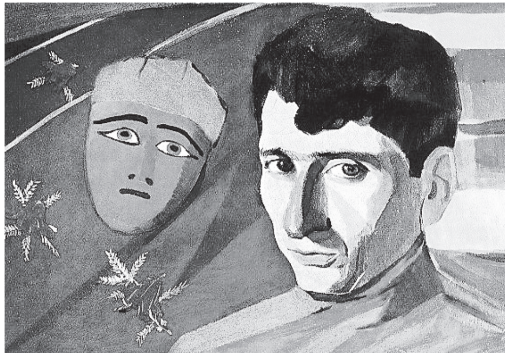
Աստիորոս Սարյան. «Եղիշե Չարենցի դիմանկարը», 1923 թ.

Հաջորդ գլուխներում համապատասխանաբար և բազմաձևոր ներկայացվում են Չարենցի կապերը ժամանակի երևելի դեմքերի հետ՝ Վահան Տերյան, Հովհաննես Թումանյան, Ավետիս Ահարյան, Ասոս Յարձանյան (Սիամանթո), Դանիել Վարուժան, Նիկոլ Աղբալյան, Արշակ Չոպանյան, Արմենուհի Տիգրանյան, Վարդգես Ահարյան, Հակոբ Օշական, Կոստան Չարյան, Ավետիք Իսահակյան, Վահան Նավասարդյան, Խմբապետ Շավարշ, Ալսեի Բակունց, Երվանդ Քոչար... Ամբողջ շարադրանքի ընթացքում ներկա են նաև այլ անուններ՝ Դեմիրճյան, Չորյան, Աբով, Դաշտենց, Արմեն, Վշտունի և ուրիշներ... Ահա