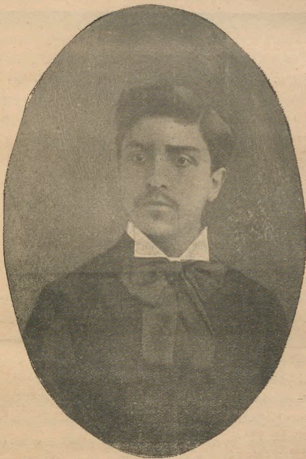
ՅՈՎ. ՇԱԻՆԻՇ ՍԻՆՏՄԵՆՆԻ ( 1877 — 1901 )