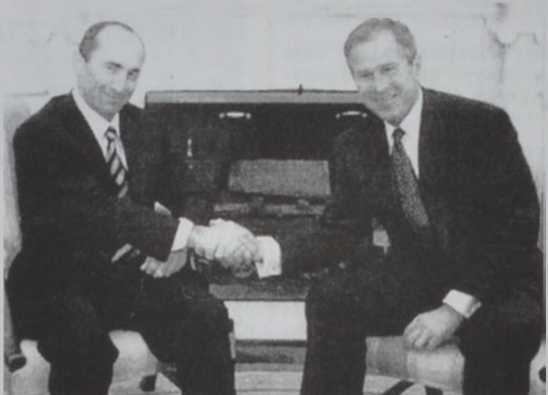
Պուշ կը ընդունի Քոչարեանը:

Ամերիկացի այլ պաշտօնատար մը ըսաւ, որ հանդիպումներուն նշուած է, որ խաղաղութիւնը ղրական ազդեցութիւն կ'ունենայ ամբողջ