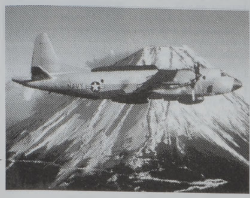
«Ի. Փի. - 3» տիպի օդանավ

Չինաստանի նախագահ Ջիանկ Ծենին երկն պահանջած է, որ Մ. Նահանգներ ստանան անհրաժեշտ փողային օգնությունները՝ չինական ռազմական օդանավի մը եւ ամերիկեան լրտեսական օդանավի մը միջեւ տեղի ունեցած բախումին եւ վերջ տան Չինաստանի ծովային մօտ հսկողութեան բոլոր թռիչքներուն: