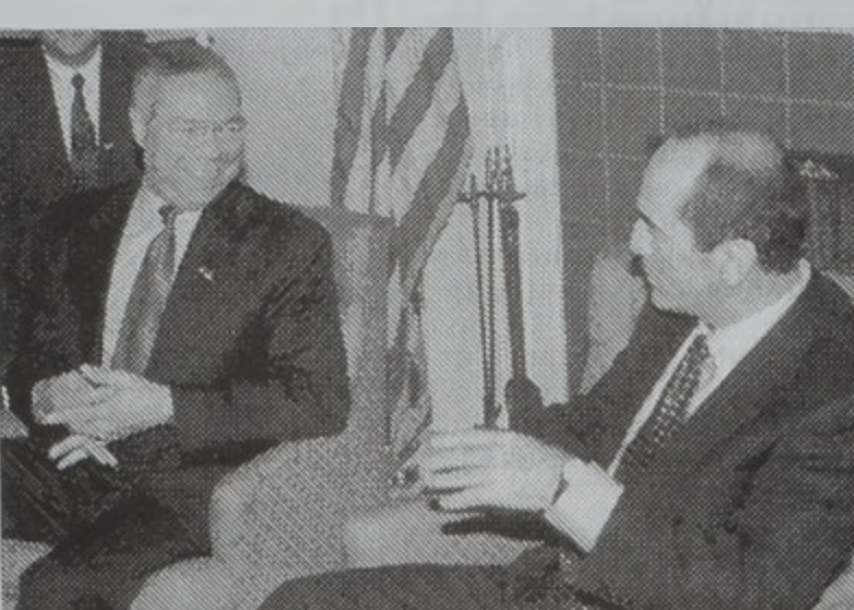
Նախագահ Քոչարեան կը տեսակցի Բ. Փաւուրի հետ

Միացեալ Նահանգներու արտաքին գործոց նախարար Քոլին Քլինթոնը երէկ Քի Ուէսթի մէջ տեսակցութիւններ ունեցաւ Հայաստանի եւ Արարատի մարզի նախագահներուն հետ ՄԱԿի համակարգին մասին խորհրդածողովի մասնակցած ՄԱԿի գործակալութիւններուն Լիբանանի մէջ ներկայացուցիչները: Հանդիպումին շեշտը դրուեցաւ հարաւային Լիբանանի ակնապերձման աշխատանքները փութացնելու անհրաժեշտութեան վրայ: