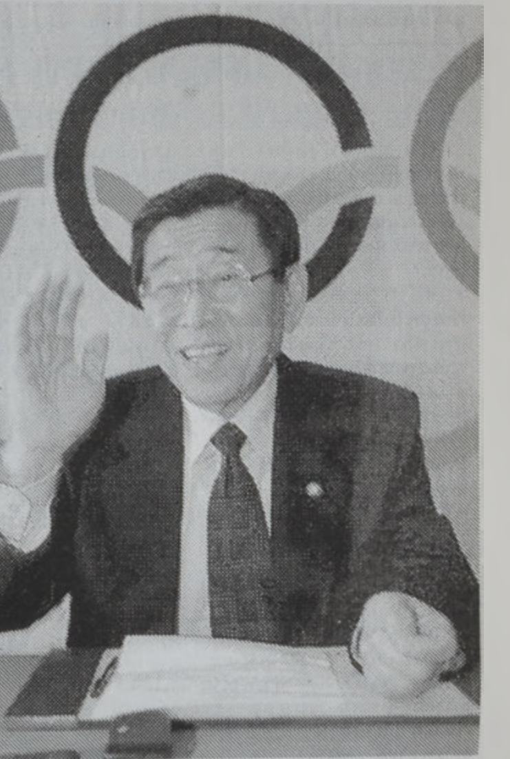
Քիմ Ուն - Եոնկ

70 տարեկան հարապակի քրեացի Քիմ Ուն - Եոնկ երէկ քաւ, թէ ինք ծեր չէ եւ կրնայ Ողիմպիական Միջազգային կոմիտէի նախագահ ըլլալ: Քիմ այդ պաշտօնին 5 թեկնածուներէն ամենէն տարեցն է: Քիմ կ'ըսէ. «Նախագահ Սամարանչ 81 տարեկան է, ուրեմն ի՞նչն է, որ ան լի քան 10 տարի փոքր մը չստանան անոր պաշտօնը»: