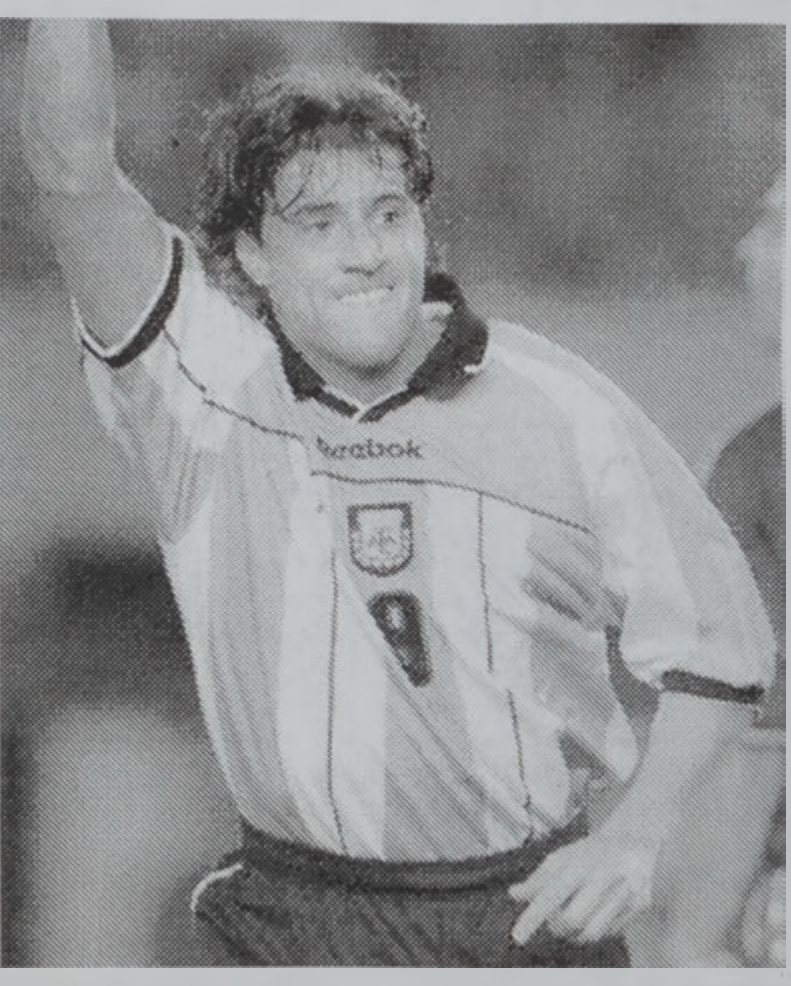
Հերնան Բրեսթի, որ նշանակեց Արժանթինի առաջին կոլը:

Մոնտիալին մասնակցելու, այժմ կը գրաւէ 4րդ դիրքը, մէկ կէտով ետ մնալով Պրագիլէն: