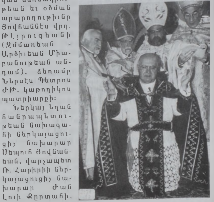
Յովհաննէս եպ. Թէրոյզեան:

Կիրակի, 25 Մարտ 2001ին, Պուրճ Համուտի Ս. Փրկիչ Եկեղեցւոյ մէջ տեղի ունեցաւ եպիսկոպոսական ձեռնադրութեան եւ օծման արարողութիւնը: