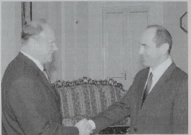
Զիուկանով Բոչարեանի մօտ:

Հայաստանի նախագահ Ռուպերթ Քոչարեան երէկ ընդունեց Ռուսիոյ Համայնավար Կուսակցութեան ղեկավար Կենստի Զիուկանովը, որ Երեւան կը գտնուի Հայաստանի Համայնավար Կուսակցութեան Համագումարին մասնակցելու համար: