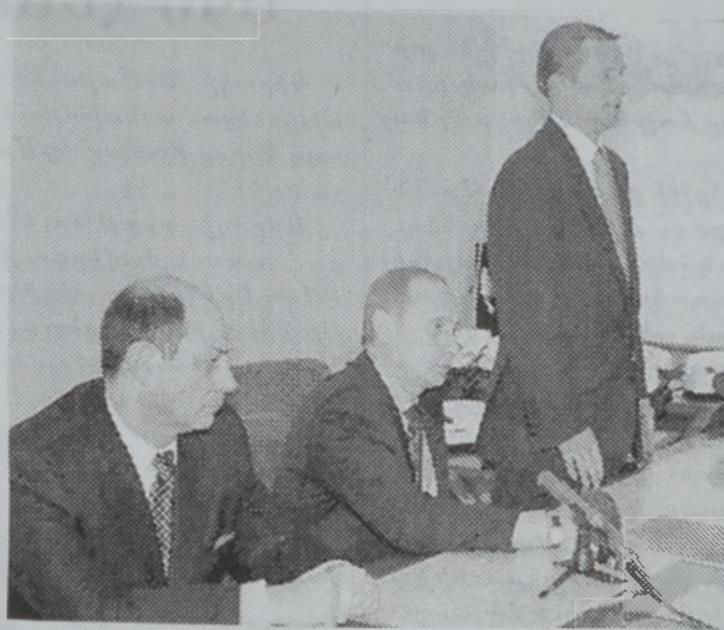
Փութին՝ ժողովի պահուն:

Արտասովոր յօդուածի մը մէջ, «Ինթըրֆաքս» լրատու գործակալութիւնը մէջբերած է «սպա-