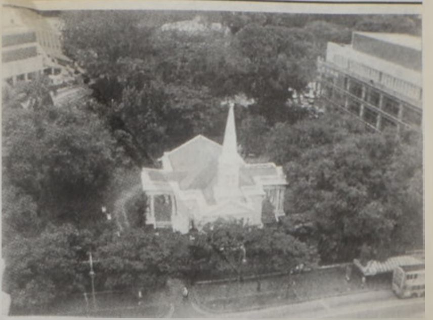
Սիճկափորի Ա. Գրիգոր Լուսաւորիչ Եկեղեցին: