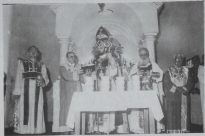
Կ օրինակի երիտասարդ

Ամրող շաբաթ մը, 19-24 Մարտին, Եկեղեցին ունեցաւ յատուկ ժամերգութիւններ, իբրեւ ՌԻՏՏԻ ՇԱՌԻԹ: Երեկոները տեղի ունեցան հսկումի արարողութիւններ, իսկ Եկեղեցւոյ թաղական խորհուրդը, Տիկնանց յանձնախումբը եւ զպրաց դասը կատարեցին: