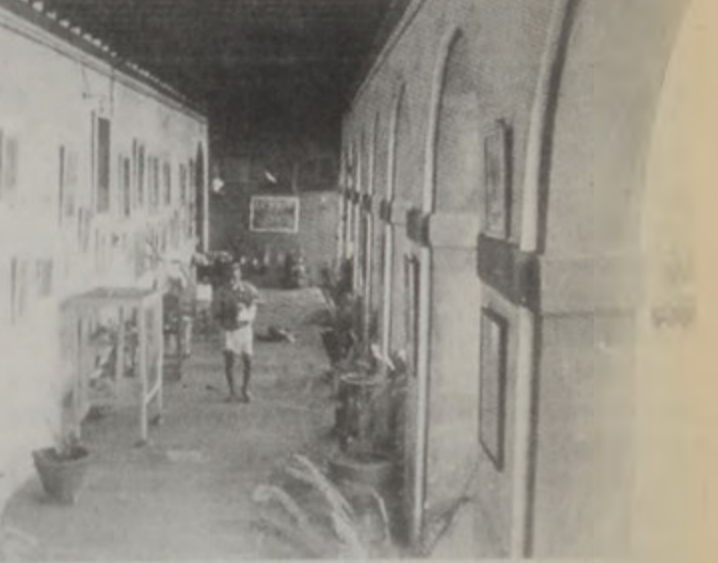
Մատրասի Ա. Աստուածածին եկեղեցւոյ մուտքը