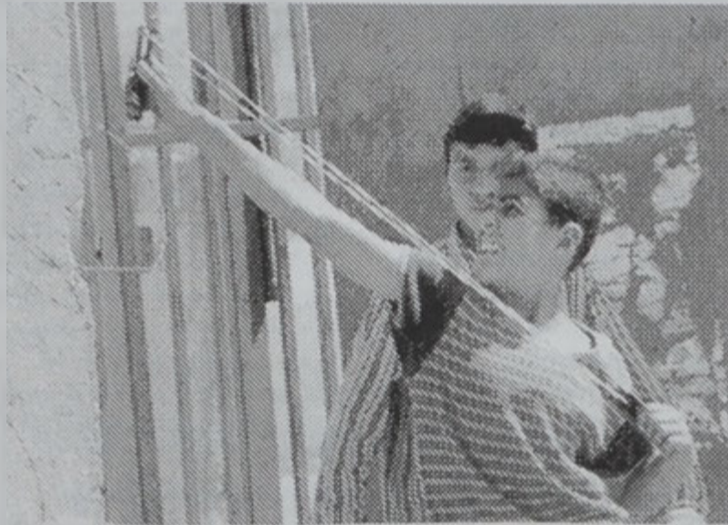
Պատահիները եւս կը մասնակցին ինթիֆատային:

Չորեքշաբթի երեկոյեան Իսրայէլի վարչապետ Արիէլ Շարոն հրահանգած էր ուժերու դէմ Արաֆատի ուժերուն գործադուլներուն, որոնք կազմակերպուած էին Ռամադայի մէջ կը գտնուէին: Իսրայէլեան բանակի ռազմաթիւնները ուժերուն ու հրթիռներուն տարափի մը տակ առին յիշեալ կեդրոնները: Իսրայէլ յայտարարեց, որ պաղեստինեան ապստամբութեան ուժերը թիրաք վարձուցած է՝ զգուշացնելու համար արմատական շարժումներու գին: