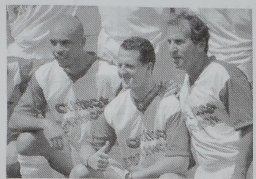
Չախէն աջ՝ Ռոնալտո, Շումախըր եւ Զիբո:

11 մասուն բացակայութենէ մը ետք պարզիցի յառաջապահ Ռոնալտո երէկ վերադարձաւ դաշտ, ուր Մարաթա զաշտին վրայ (Պրագի) տեղի ունեցած մրցումին, իր մասնակցութիւնը բերաւ ԵՌՆԻՍԵՖԻ ԿՈՂՄԵ կազմակերպուած Ֆուլթայլի բարեսիրական մրցումի մը ընթացքին: