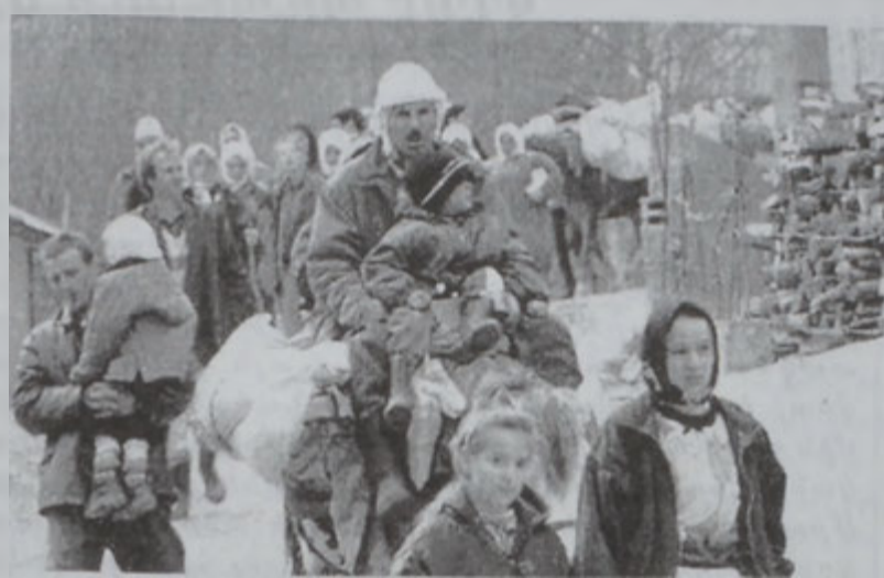
Ալպանացիներ խոյս կու տան Մակեդոնիայէն դէպի Զոսովո:

Ռոպրթսըն յայտնած է, թէ ՕԹԱՆեան ուժեր Քոսովոյի սահմանին կը հսկեն արգելափակելու համար ըմբոստներու եւ վէնքերու Մակեդոնիա մուտքը: