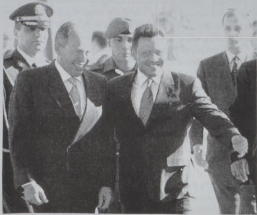
Ապտալա թագաւոր կը դիմաւորէ Գախագահ Լահուտը:

Նախագահ Կոր. Էմիլ Լահուտ երէկ յետմիջօրէին Պէյրութէն մեկնեցաւ Ամման, գլխաւորելով Արաբական Լիկայի ԺԳ. վեհաժողովին մասնակցող լիբանանեան պատուիրակութիւնը, որուն մաս կը կազմեն ընդհանուր ապահովութեան ուժերու ընդհանուր տնօրէն Կոր. Ժամիլ Սայէտ, արտաքին գործոց նախարարութեան ընդհանուր քարտուղար Չուհէյր Համտան, Ամմանի մէջ Լիբանանի դեսպան Ատիպ Ալամէտ-տին, արտաքին գործոց նախարարութեան քաղաքական հարցերու բաժնի պետ Նաժի Ապի Ասի եւ նախագահական պալատի տնտեսական եւ ընկերային հարցերու բաժնի ընդհանուր տնօրէն Էլի Ասսաֆ: