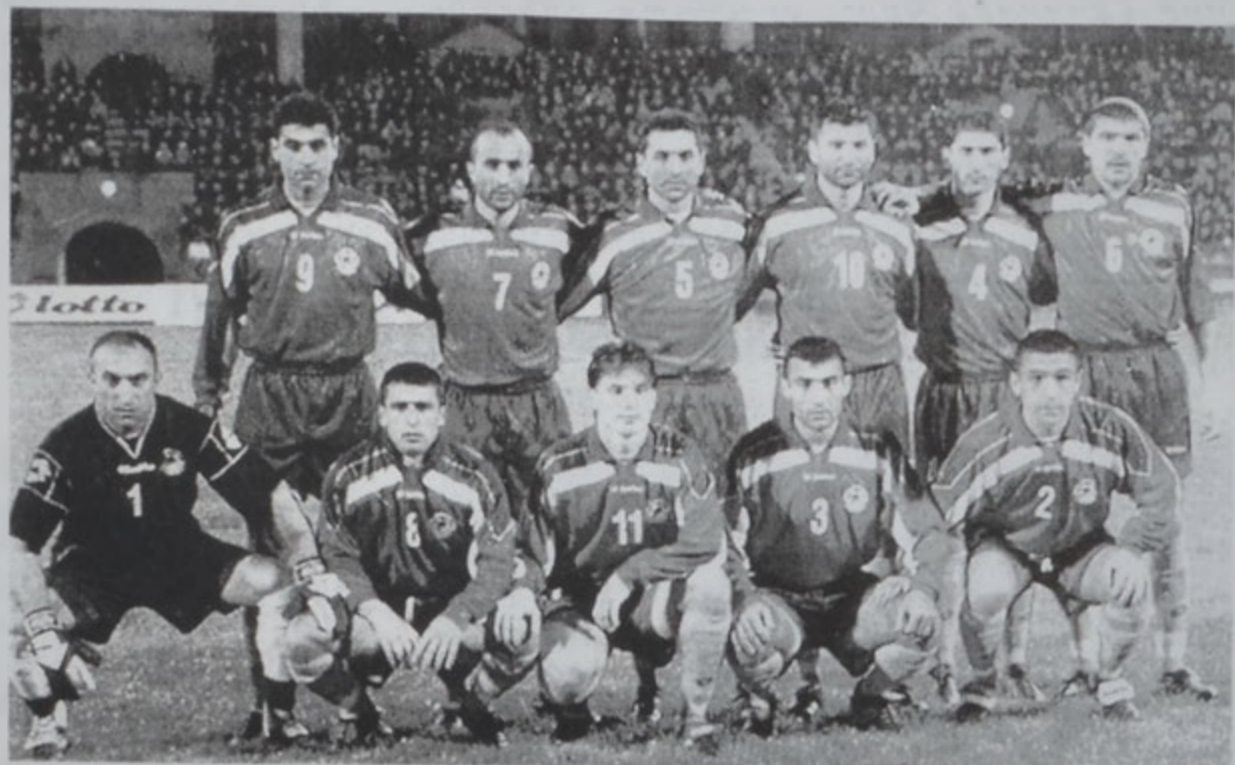
Հայաստանի ազգային խումբը

2002ի Մոնտիալի պտուճի մրցաշարքին, Ե. իմբակէն ներս Հայաստանի ֆուտբոլի ազգային խումբը վաղը ունի դժուար մրցում մը՝ իմբակին պարագլուխի դիրքը գրաւող Լեհաստանի դէմ, որ ցարդ որեւէ պարտութիւն չէ արձանագրած: