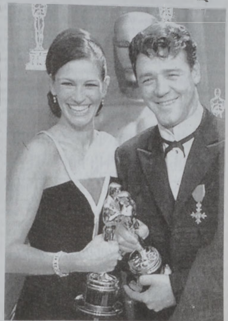
Ճուկա Ռոպրթսըն եւ Ռաբլ Զրօ:

Բրիտանացի Ռաբլի Սքոթի բեմադրած «Կլէտիէյթըր» ֆիլմը իւլեց օսքարներու առիծի բաժինը՝ շահելով հինգ օսքարներ: «Կլէտիէյթըր»-ի գլխաւոր դերասան Ռաբլ Զրօ շահեցաւ լաւագոյն դերասանի օսքարը, ֆիլմը նաեւ շահեցաւ չորս օսքարներ՝ լաւագոյն ժապաւէնի, տարապներու յղացման, ձայնի եւ տեսողական ապրեցութիւններու: