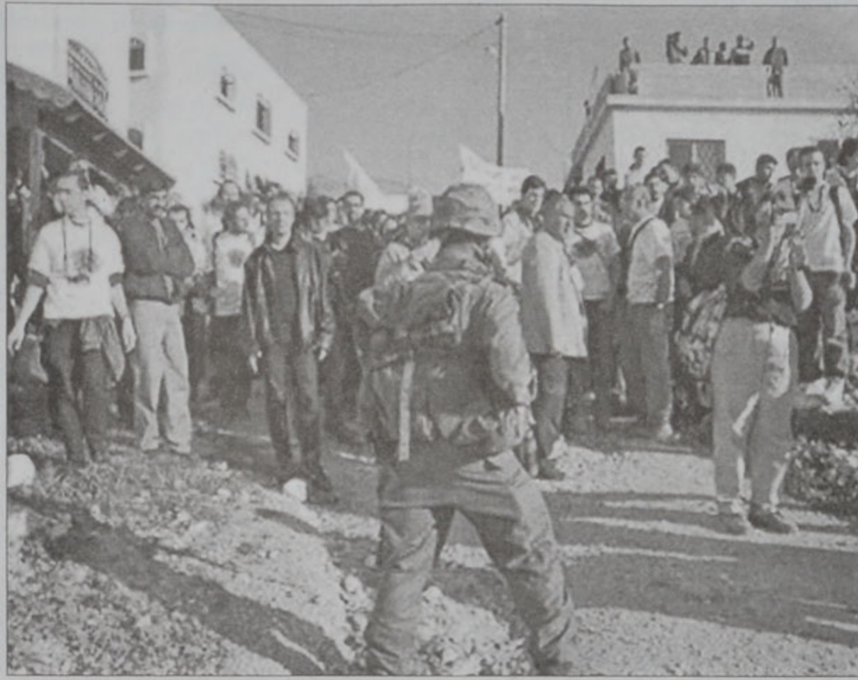
Իսրայէլացի զինուոր մը արգելք կը հանդիսանայ պաղեստինցի ցուցարարներուն Զալքիի մէջ

Իբրեւ իսրայէլացի ծայտուած պաղեստինցի մը սպաննուեցաւ Կազա-Իսրայէլ սահմանին վրայ, ուր բախումներ արձանագրուած են: Երկու այլ պաղեստինցիներ սպաննուեցան Այսրայէլ-ղանանի մէջ: