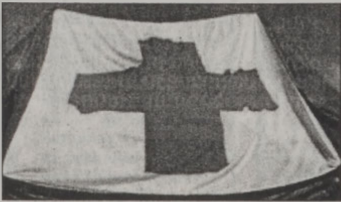
Արդեօք Կարմիր Խաչը ո՞ր պիտի բացընէ կազմակերպութեան խորհրդանիշ քրիստոնէական խաչը...

ԿԸ ԹՈՒԻ, ԹԵ ԿՐՕՆԱԿԱՆ ՏՕՆԵՐԸ ԲԱՐՂՈՅԹՆԵՐ ԿԸ ԱՏԵՂԾԵՆ ՔԱՂԱՔԱԿԱՆ ԱՐՈՒՍՈՒԹԵԱՄ ԶԱՏԱՆՇՈՒՄ ԱՐԵՒԵԼԻ ԵՒ ԱՐԵՒՈՒՏԵՐ ՄԻՋԵՒ: ՄԻՋԱՁԱՅՆԻ ԿԱՐՄԻՐ ԽԱՉԸ «ԻՍԼԱՄՆԵՐԸ ԶԱՐԳԵԼՈՒ ՓԱՓԿԱՆԿԱՏՈՒԹԵԱՄ»՝ Ա. ՇՆՆՂԵԱՆ ՉԱՐԴԵՐԸ ԿԸ ՎԵՐՑԵ ԲՐԻՏԱՆԻՅՈՒ ԲԱՐԵՍԻՐԱԿԱՆ ՎԱՃԱՍՏՈՒՆԵՐԵՆ: «ՊԻ. ՊԻ. ՍԻ.» ԿԸ ՎԱՐԱՍՆԵ: