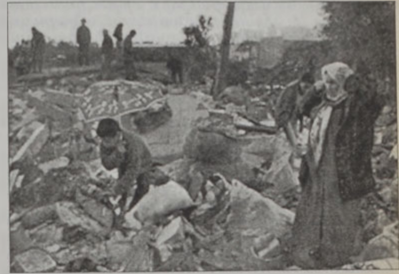
Ապրտ Ալալ ընտանիքի անդամներ կը փորձեն իրենց տան աներկցեցրու մէջէն դուրս բերել ինչ որ հնարաւոր է

Իսրայէլեան քաղաքին մօտ գտնուող Մորակ բնակեցման վայրին վրայ Շարաթ գիշեր գործուած յարձակումին վիրաւորուած էր իսրայէլացի զինուոր մը: Իսրայէլեան ուժերը յաջողած են սպաննել յարձակում գործող պաղեստինցիներ: Պաղեստինի Ազատա-