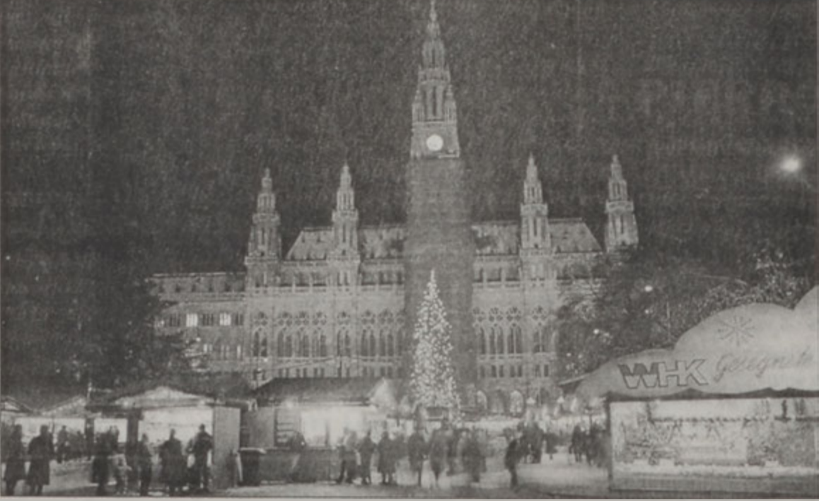
Վիեննայի Ս. Ծննդեան շուկան

պատկերը ստեղծուած է Գոթա Գոյայի ընկերութեան կողմէ, որ Գոթա Գոյային կարմիր եւ ճերմակ գոյները հազուադէպ է այս տիպարին եւ գայն օգտագործած է ձմրան եղանակին իր արտադրութիւնները վաճառելու համար: Յայտնապէս Աւստրիոյ մէջ կաղանդ Պապան կը նկատուի մամբրիկեան քաղաքացիական ընկերութեան համաշխարհային աւերիչ հասոցութեան մէկ այլ օրինակը: