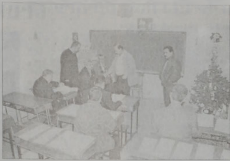
Լուսանկարը՝ Սթիւտիո «ԱՇՆԱԿ»ի նաւի թեմի բոլոր եկեղեցիներուն մէջ տեղի ունեցած թագականութեան բնորոշ թիւերը:

Եկեղեցիներու շրջափակերուն կամ թագականութեան գրասենյակներուն մէջ, յատուկ յանձնարարութեամբ հսկողութեան տակ կազմեցած բնորոշ թիւերուն 20 տարիքին վեր եղող ազգայինները բնորոշին այն անձները, զորո յարմար նկատեցին այս առաքելութեան շարունակման համար: Ընարուցիկան ասի փերը բաց մնացին միջին երեկոյեան ժամը 5:00 եւ ասիթարուեցաւ ծիսակարգը: