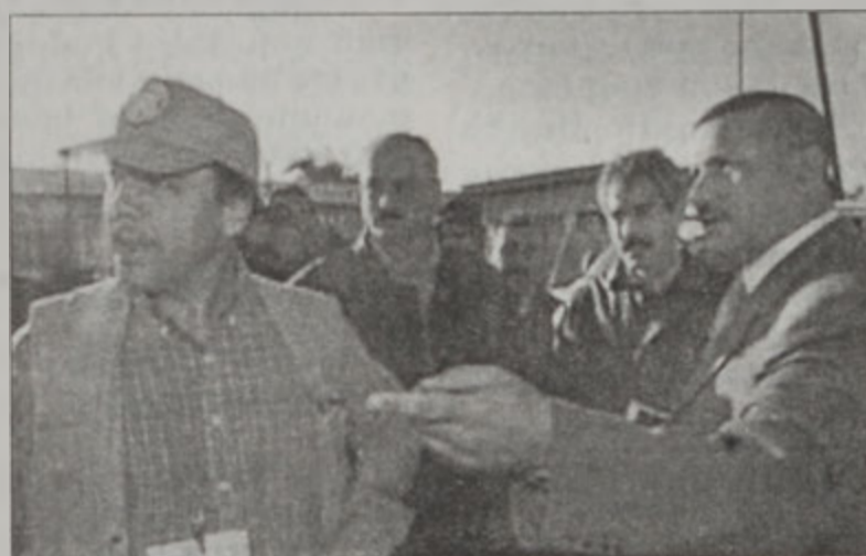
Իրաքի պաշտօնատար մը կը խորհրդակցի ՄԱԿի գէնքի բնօրէն մէկուր հետ ճախքան գէնքի գործարարի մը ստուգումը

«Նիւ Եորք Թայմզ» օրաթերթը կը գրէր, թէ Ուաշինկթըն քննիչ-