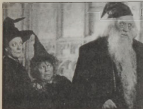
արահներու մէջ ցուցա-

Իր ամբողջութեան մէջ «Հէրի Փոթըր էնտ տը չէյմպըր աֆ սիքըրթց» կու տայ այն, ինչ որ մանուկ ու պատանի հանդիսատեսները կ'ուզեն: Անոնք դժուար կացու-