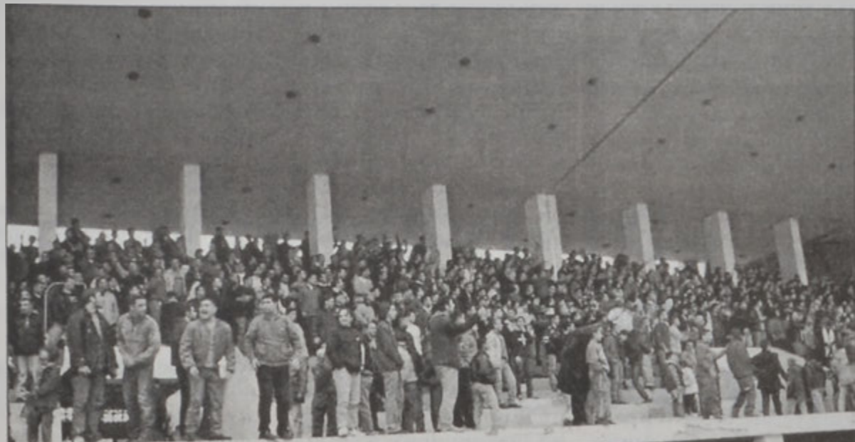
Հ.Մ.Ը.Մ.ի համակիրները, որոնք երէկ լեցուցած էին դաշտին թրիպիւնները

Լիբանանի ֆուտբոլի Բ. դասակարգի ախոյեանութեան 7րդ հանգրուանին, երէկ, Պուրճ Համուտի Բաղաբապետարանի դաշտին վրայ Հ.Մ.Ը.Մ. իր բազմահազար համակիրներուն ներկայութեան արձանագրեց եղանակի իր վեցերորդ յաջորդական յաղթանակը, այս անգամ պարտութեան մատնելով Ռասինկը՝ 4-0 արդիւնքով: