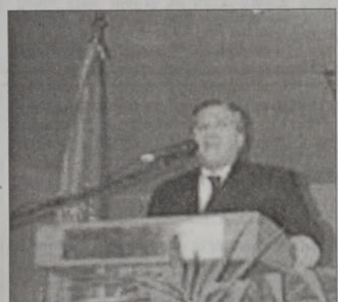
Դեսպան Ա. Յովհաննիսյան