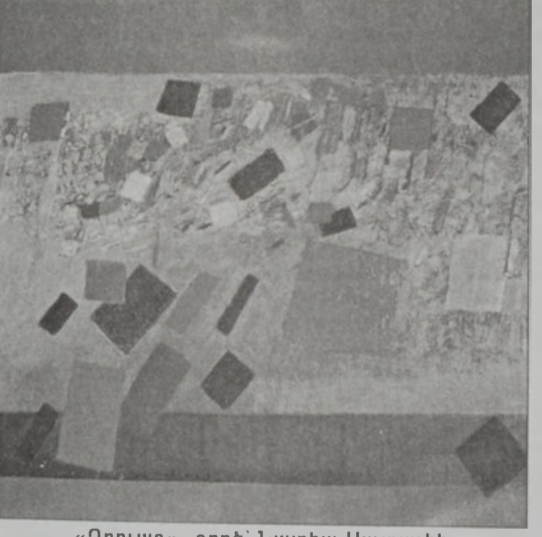
«Դրուագ». գործ՝ Նատիա Սայքալիի

Պ.- Յաճախ ես կը փորձեմ վերադառնալ արժատ-