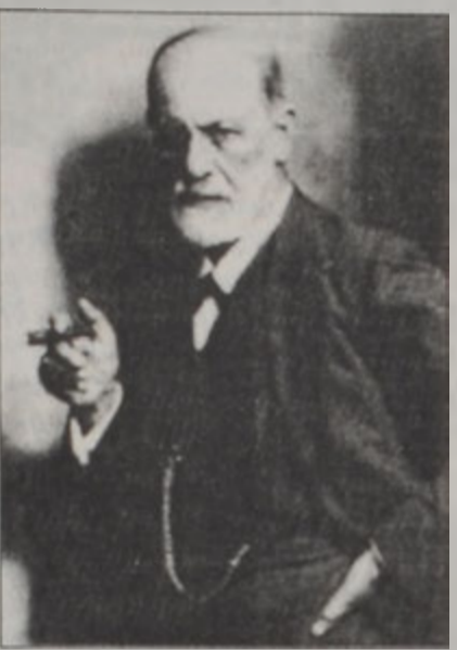
Սիկարնոս Ֆրոյտ 1922ին օրական 20 սիկար կը ծխէր:

Սպանիոյ, Փորթուգալի, Իտալիոյ եւ Անգլիոյ մէջ 16րդ դարու վերջերուն ծխախոտն ու սիկարը արդէն ծանօթ էին վերնախաւին: Սակայն եւրոպացիք այնքան ալ խանդավառ չէին, եւ ծխախոտին թշնամիները բազմաթիւ էին: Բրիտանիոյ ձէյմզ Ա. թագաւորը բժիշկներու կարծիքին վրայ հիմնուելով՝ 1619ին ծխախոտը կոչած էր «գարշահոտ խոտ» եւ ծխելու նորածնութիւնը դատապարտած էր իր բնական ստուգուած եւ ստրուկ հնդիկներուն գազանաբարոյ սովորութիւններուն կապկուածը: Ան ըսած էր, թէ ծխելը «ուղեղին համար զագրելի սովորութիւն մըն էր, վնասութիւն չի բերուած, իսկ սեւ ծուխին գարշահոտը ամէնէն աւելի կը յիշեցնէր ստիւքսեան անյատակ դժոխքը»: Ան միացող չորցած տերեւները մահացու համարելով՝ արգիլած էր անոնց տարածումը, սակայն արգելք անմիջապէս առաջնորդած էր մաքսանենգութեան: