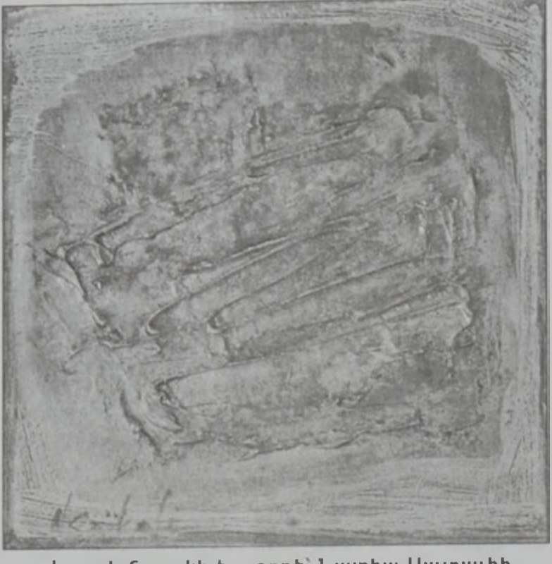
«Լուսինը ոսկի է...» գործ՝ Նատիա Սայքալիի

Պ.- Անշուշտ: Կը շուրջը, շարժումը, տարածութիւնը՝ այս բոլորը յատուկ են թէ՛ երաժշտութեան եւ թէ՛ իմ պատկերած վերացականութեան: Տարբերութիւնը այն է, որ երաժշտութեան մէջ զգացումները կախեալ են կշռութաւոր գոյներէն, իսկ վերա-