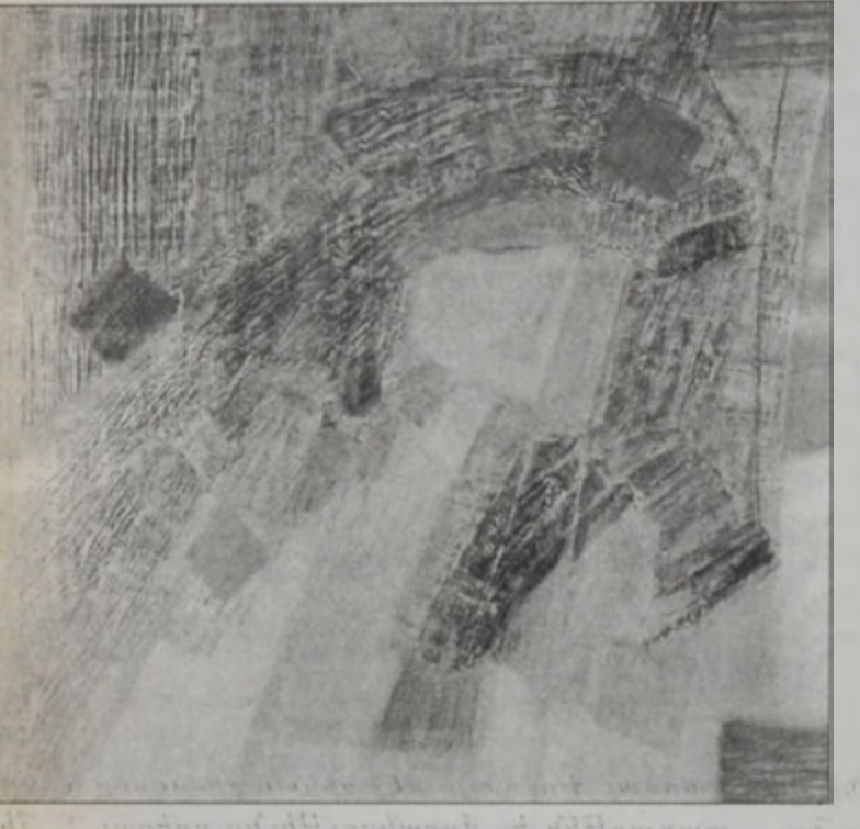
«Ժամանակի առեղծուածը». գործ՝ Նատիա Սայքալիի

ՀԱՅՐՈՒՄ.- Ինչու վերացականութեան կը հետեւիր: