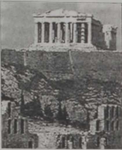
Փարթենոնի տաճարը, ուրկէ պոկուած են Էլկինի մարմարները:

Աշխարհի առաջնակարգ թանգարանները կ'ըսեն, թէ դրական դեր ունեցած են վիճելի միջոցներով ձեռք բերուած հնագործական իրերու վերադարձնելու գնահատականները մէջը: Սակայն մշակութային շրջանակներ կը դատապարտեն անոնց յայտարարութիւնը իբրեւ վերջին փորձ մը՝ պաշտպանելու Բրիտանական թանգարանին կողմէ Փարթենոնի մարմարներուն շարունակուող սեփականութիւնը: