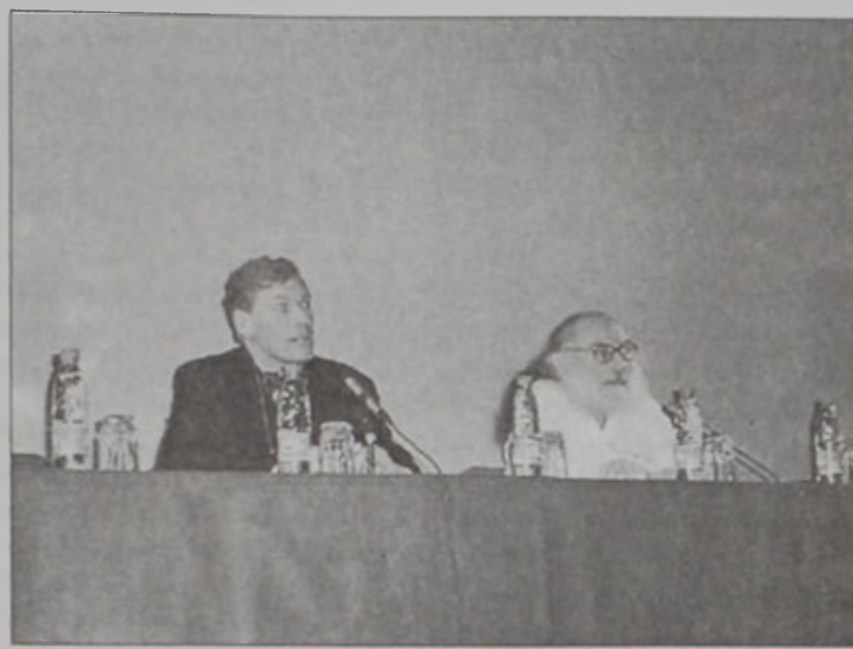
Պատմաբաններ՝ Վուազէն եւ Մուրաֆեան

«Թէր Տիւ Լիպան» հրատարակչատունը վեր- ջերս լոյս ընծայեց ֆրանսացի պատմաբան Ժան - Քլօտ Վուազէնի «Լէ սիթատէլ տիւ ռուայով արմէնիէն տը Սիլիսի 12-19 սիէքլ» («Կիլիկիոյ հայկական թագաւորութեան ամրոցները, 12րդ- 19րդ դարեր») խորագրեալ պատկերապարզ հա- տորը: