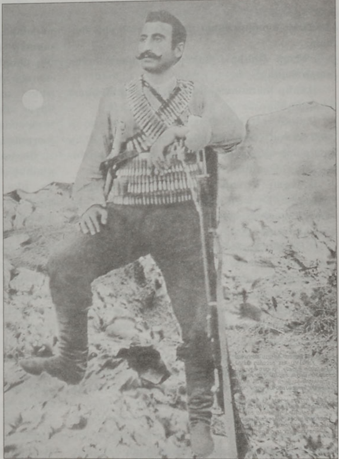
մահով մահը կը կոխէ անմեռ մնալու համար:

Եւ այս նշանաբանը ընտրեց ո՛չ իբր բառ, այլ՝ իբր գործ. քարոզեց ո՛չ իբր խօսք, որ մեռեալ է առանց գործի, այլ իբր կենդանի գաղափար, որ