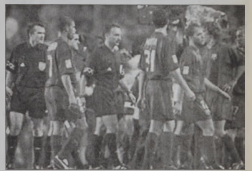
Սպանացի իրաւարարը, որ Պարսելոնա - Ռէալ Մատրիտ մրցումը ընդհատեց

Սպանիոյ Ֆուլթոնի ֆետերասիոնը, քննարկելէ ետք անցեալ Նոյեմբեր 23ին Պարսելոնա - Ռէալ Մատրիտ մրցումին ընթացքին (Սպանիոյ ախոյեանութիւն) արձանագրուած զէպքերը, վճռեց երկու մրցումի համար փակ պահել «Նուքամփ» դաշտը եւ Պարսելոնա ակումբը չորս հազար եւրո տուգանքի ենթարկելու: Անիկա իր երկու մրցումները պիտի կատարէ այլ դաշտի վրայ: