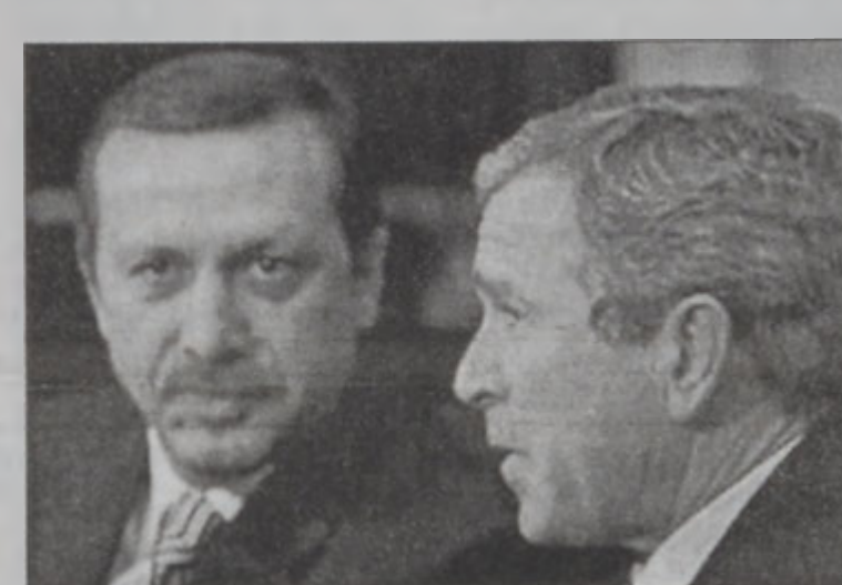
Պուշ կը փորձէ սիրաշահիլ Անգարան

Թուրքիա կը պահանջէ, որ Ե. Միութեան ղեկավարները Քոփենհագենի մէջ յայտարարուած իրենց վեհաժողովին յստակ թուական մը ճշդեմ քանակցութեանց սկսած համար: Ե. Միութիւնը կ'ըսէ, որ Թուրքիա պէտք է մարդկային իրաւանց