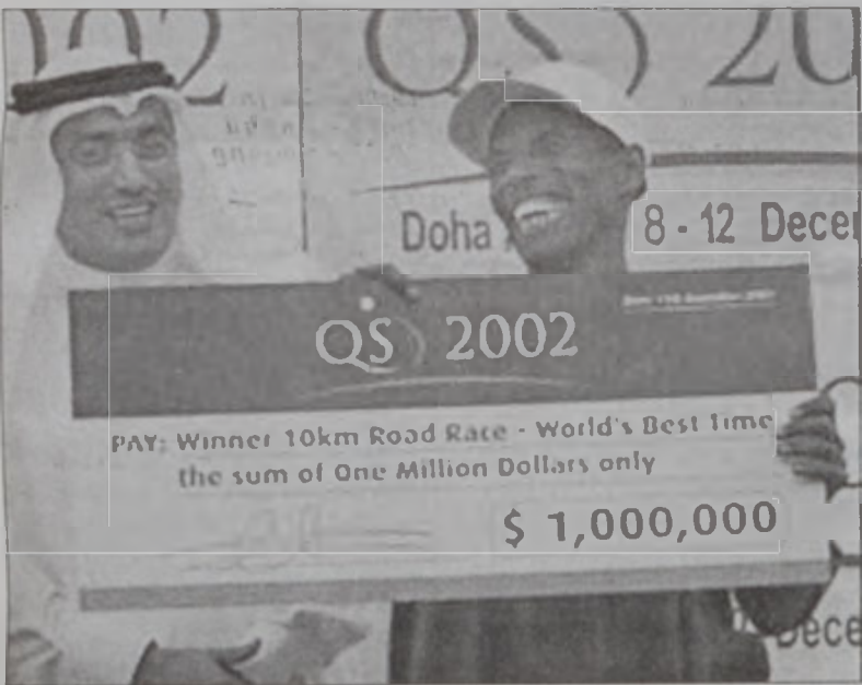
Կեպրեսելասի (աջից) կը ստանայ իր մէկ միլիոն տոլարի ցուէրը

Եթովպացի աթլետ Չէյլ Կեպրեսելասի երէկ Տոհայի մէջ (Քաթար) 10 քմ. վազքի մրցումներուն աշխարհի նոր մրցանիշ մը հաստատեց, երբ արձանագրեց 27 վայրկեան եւ 2 երկվայրկեան արդիւնք մը՝ բարելաւելով քենիացի Սէմի Բիլքեթթրի հաստատած նախկին մրցանիշը (27' 11''):