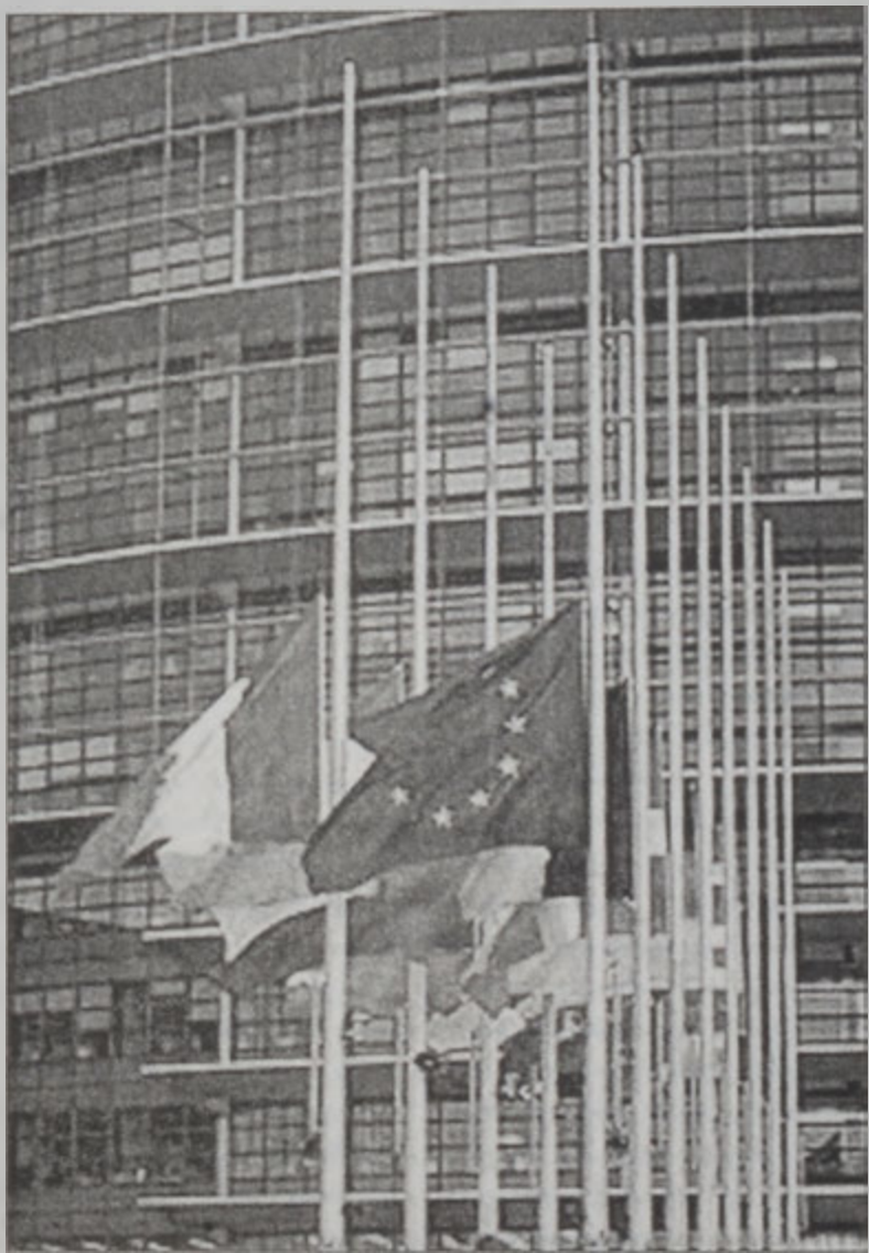
Եւրոպական Խորհրդարանը՝ Սթրասպուրկի մէջ

2.- Եւրոպական խորհուրդը, որ Միութեան որոշումները տուող հիմնական կառույցն է: Խորհուրդը Միութեան օրէնսդրական մարմինն է: Անկա կը համադրէ անդամ երկիրներուն տնտեսական ռազմավարութիւնը եւ խորհրդարանին հետ կը հսկէ Միութեան պիւտճէն: Խորհուրդը կու տայ այն հիմնական որոշումները, որոնք կը ձեւաւորեն Միութեան արտաքին եւ ապահովութեան քաղաքականութիւնը: Միութեան անդամ երկիրներուն միջեւ յարաբերու-