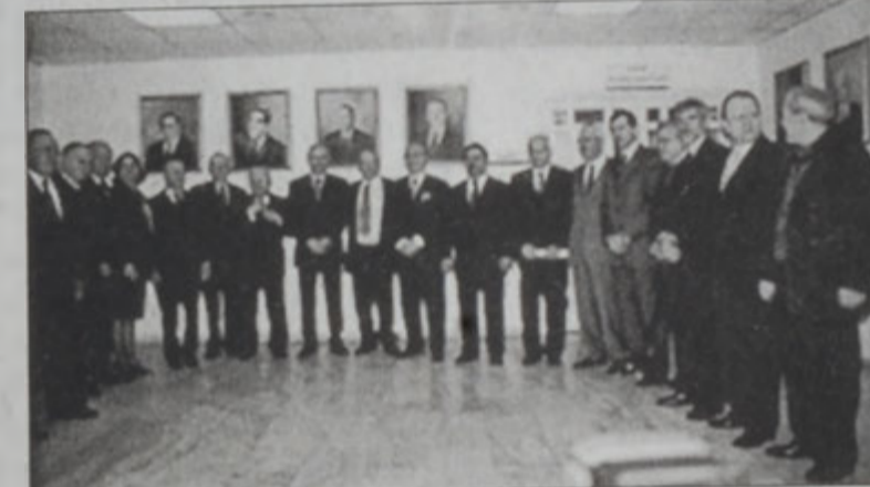
Լրագրողներու սենտիքայի ճոր վարչակազմ խորհուրդը

Լրագրողներու սենտիքայի ընդհանուր ժողովը երէկ ընտրեց սենտիքային ճոր վարչակազմ խորհուրդը: Ժողովին ներկայ գտնուեցան տեղեկատուութեան նախարար Ղազի Արիտի եւ ինքագիրներու սենտիքայի նախագահ Մըլիէմ Քարամ: