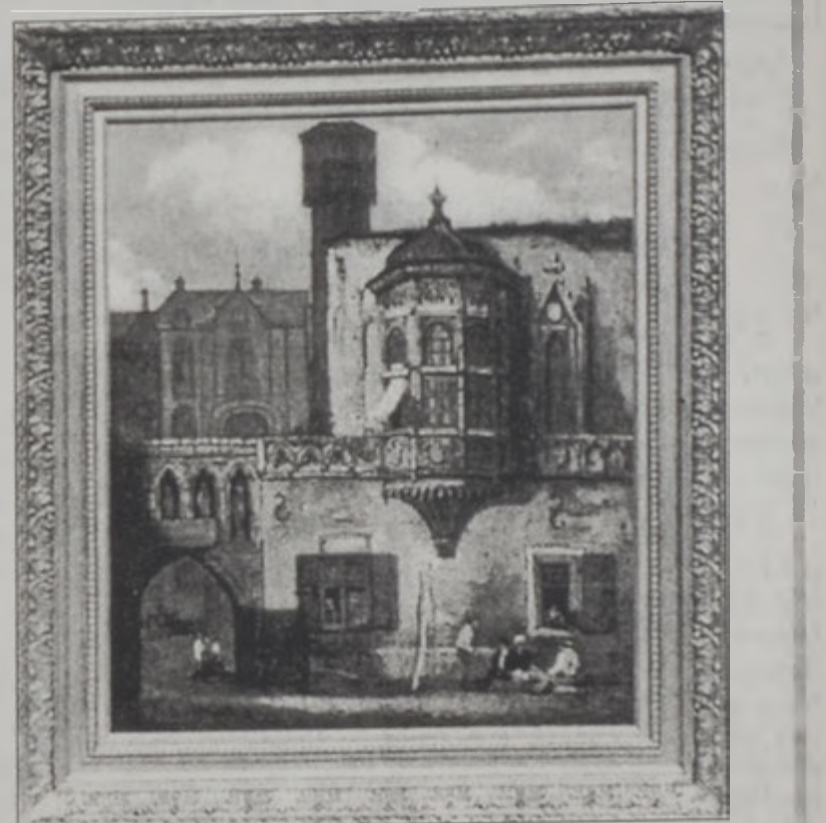
Նմուշ մը՝ Սամուէլ Փրուսի գործերէն

Գեկտեմբեր ամսուան ընթացքին «Ամաթօր» ցուցասրահին մէջ կը ցուցադրուին 19րդ դարու վիպապաշտ գեղանկարիչ Սամուէլ Փրուսի (1783-1852) գեղանկարներու մէկ հաւաքածոն: Սամուէլ Փրուսի եղած է իր ժամանակաշրջանի նշանաւոր արուեստագէտներէն մէկը, որուն գործերը իր կենդանութեան ժամանակ իսկ ցուցադրուած են Անգլիոյ «Ռոյալ Էքսիբիթի» եւ Բրիտանական հիմնարկութեան մէջ: