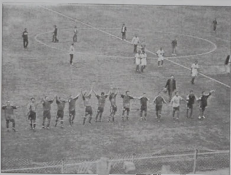
Մրցումէն ետք, առնճը կ'ողջունեն իրենց ընկերակցող համակիրները

Հ.Մ.Ը.Մ.ի համակիրները (որոնք կը գնահատուէին շուրջ 1500 հոգի), բախտը չունեցան իրենց կազմին մարզիկներուն կողմէ մեծ թիւով կոլեր տեսնելու, որովհետեւ մրցակից կազմին բերդապահը հրաշքով իր բերդը փրկեց բազմաթիւ կոլերէ, այլապէս արդիւնքը պիտի ըլլար կրկնապատիկը: