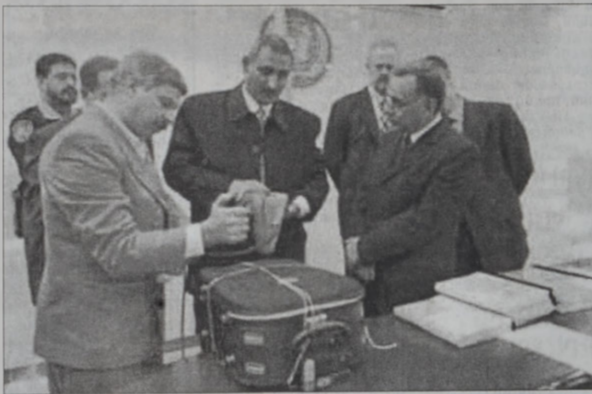
Իրաքի պաշտօնատարներ թղթածրարէն էջեր պարունակող պայուսակը կը կնքեն

12 հազար էջերէ կազմուած թղթածրար մը իրաքի իշխանութիւններուն կողմէ ուղարկուեցաւ Վիեննա եւ Նիւ