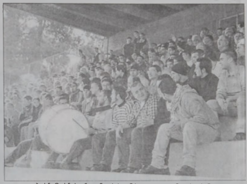
Հ.Մ.Ը.Մ.ի համակիրները, որոնք իրենց ներկայութեամբ միշտ կը մնան Հ.Մ.Ը.Մ.ի կողքին

Պրոֆ Շիմալի մրցումը չկատարուեցաւ, հարաւի կազմին դաշտն չներկայանալուն պատճառով: