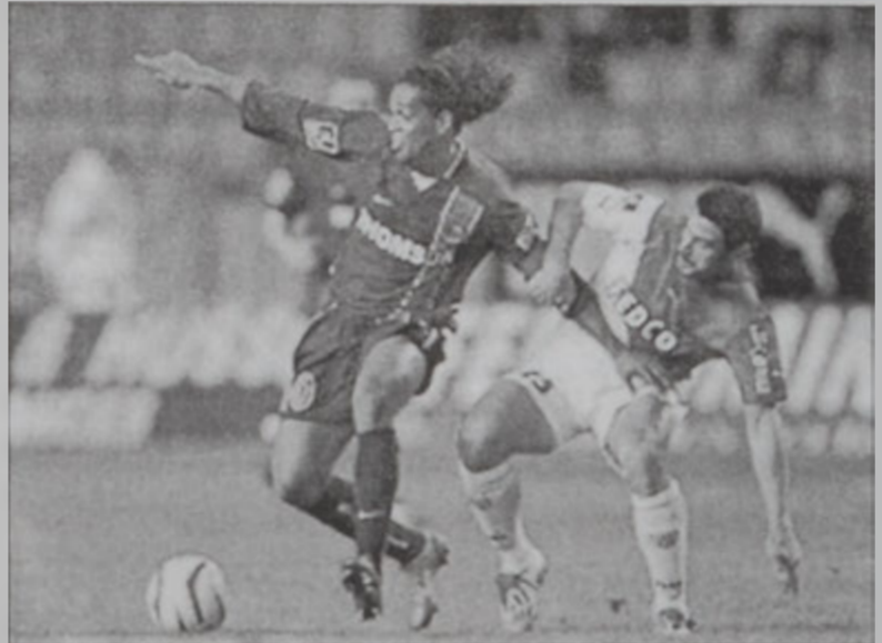
Ռոնալտինիո (ձախից), որ կը փորձէ գերազանցել Մոնթալանի մարզիկ Վասիլէու Ջիքսը