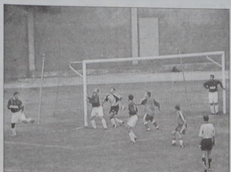
Հ.Մ.Ը.Մ. - Շապակ Թրիփոլի մրցումէն