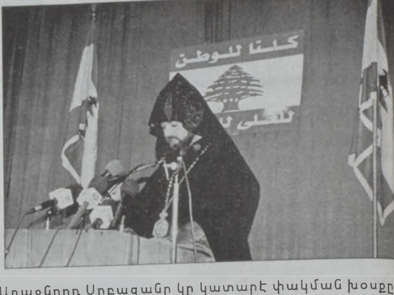
Առաջնորդ Սրբազանը կը կատարէ փակման խօսքը

արժէքները՝ շեշտը դնելով այն կէտին վրայ, որ Լիբանանի անկախութեան երեւոյթը չի սահմանափակուիր միայն դեկլարութեան մը բանադրութեամբ եւ անոր պատ արձակման իբրեւ հետեանք անկախութեան հռչակմամբ, այլ ունի խորք: Ան նշեց, որ 11 Սեպտեմբերի դէպքերէն ետք կայ արժէքներու յստակ փոփոխութիւն համաշխարհային գեոսի վրայ, եւ Միացեալ Նահանգներու միաբերեալ քաղաքականութիւնը լուրջ հարցականի տակ կ'առնէ երկիրներու անկախութեան հասկացողութիւնը: