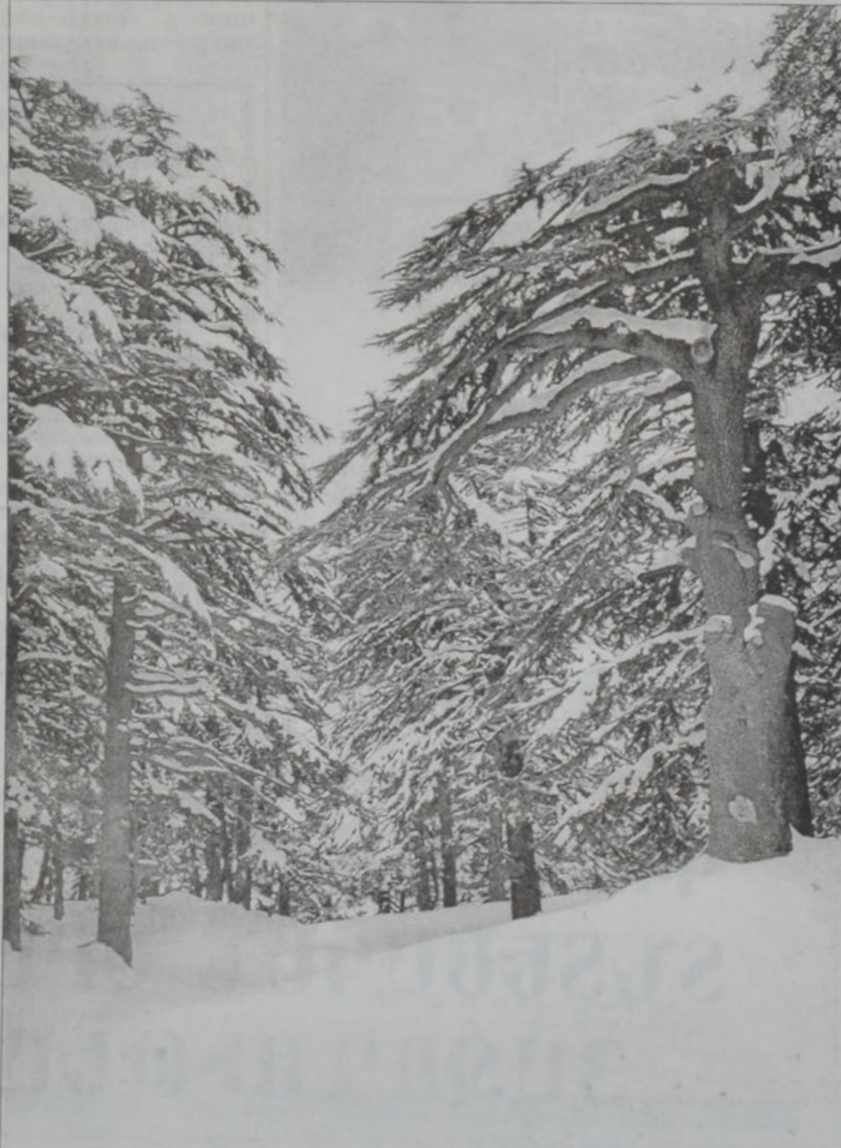
ՄԱՅՐԻ ԾԱՌԸ՝ ԸՄՊԵՋԱԿԱՆ ԼԻՔԱՆԱՆԻ ԽՈՐՀՐԳԱՆԻՇԸ