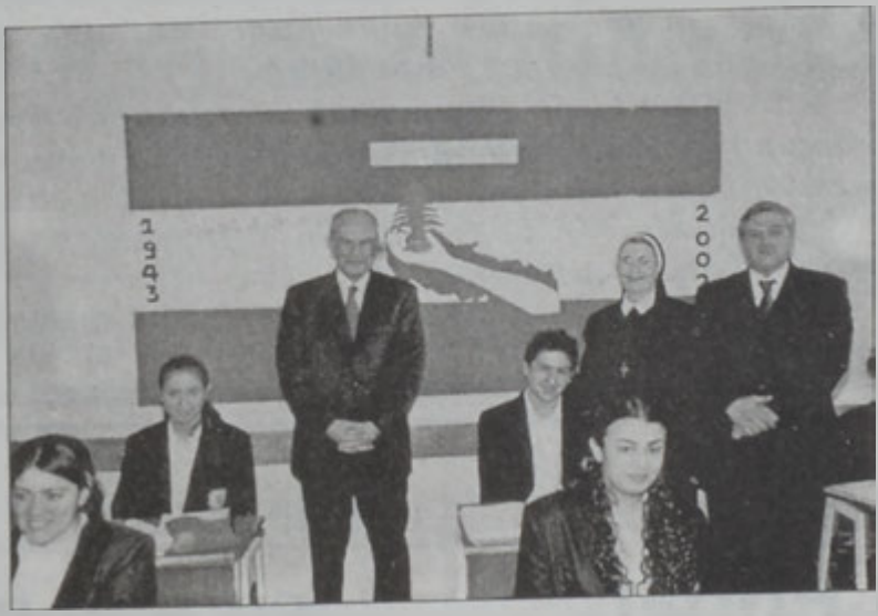
Չախէն աջ՝ նախարար Մրրատ, քոյր Թեոփաստէ եւ Հայաստանի դեսպան՝ Ա. Յովհաննիսեան

Կրթության նախարար Ապտեյ Ռահիմ Մրրատ երեկ այցելեց Անարատ Յղուրթեանի հայ քոլեջը Սրբոց Հոգևորականաց Բարձրագոյն վարժարան, ուր ներկայ գտնուեցաւ Լիբանանի անկախութեան 59րդ տարեդարձին առիթով կազմակերպուած աշակերտական տօնակատարութեան: