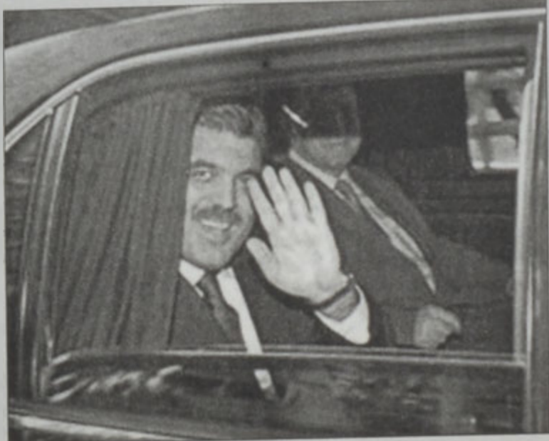
Ապտիլլա Կիլ պիտի յաջողի՞ թուրքիան մօտեցնել Եւրոպայի

Թուրքիոյ յառաջիկայ վարչապետը՝ Ապտիլլա Կիլ, երէկ թափ տուած է նոր կառավարութեան մը կազմութեան աշխատանքներուն՝ նպատակ ունենալով յատկապէս տնտեսական աճը, բարեկարգումներ եւ Եւրոպայի հետ աւելի սերտ կապերով թուրքիա մը: