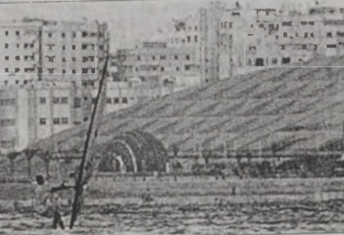
ՅԱՒԻՏԵՆԱՊԵՆ ԵՒԱՐՈՂ ԱՐԵՒՈՒ ՏԵՍԵՆՈՎ. ԱՃՐԱՅԻՆԱԳՈՒՅՑՈՒՄԸ ԴԱՐՈՒ ԵՒԱՐԱՆԻՆԵՐԸ ԿՐՈՂ ԱՂԵՍԱՆԴՐՈՒՅՑ ԳՐԱԴԱՐԱՆԸ ԿԱՅՈՒՍԸ ԵՒ ԻՏԱԳՐԱՆԵՆ ԿԱՌՈՅՑՈՒԹՅԱՆ ԿԱՌՈՅՑՈՒՄԸ:

Սակայն Աղեքսանդրիոյ համալսարանէն դասական գիտութիւններու դասախօս Մուսթաֆա Ապատի, որ գրադարանին շինութեան մղիչ ուժը կը համարուի, մտահոգութիւն կը յայտնէ, որ գրադարանը հարստացնելու հա-