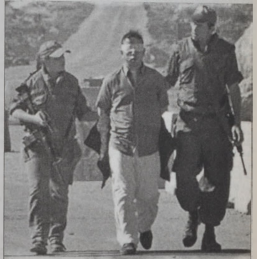
Իսրայէլացի զինուորներ հարցաքննութեան կը տանին պաղեստինցի մը, չեղարկելու մէջ

Պաղեստինցի նախարար Նապիլ Շաաթ ղառապարտեց իսրայէլեան ներխուժումը՝ քննադատելով Շարոնի կառավարութիւնը: Շաաթ ըսաւ, որ այս կառավարութիւնը հետաքրքրուած չէ խաղաղութեամբ, ոչ ալ այդ գործընթացը վերականգնելու կարելիութեամբ: Նեթանիախու, որուն իշխանութեան ընթացքին ստորագրուած էր 1997ի համաձայնագիրը, յայտարարեց, որ պաղեստինցիներուն հետ ստորագրուած բոլոր համաձայնութիւնները գոյութիւն ունենալէ դադարած են: Ան պահանջեց նաեւ արտաքին մը պաղեստինեան իշխանութեան նախագահ Եասէր Արաֆատի: Նեթանիախու Արաֆատը արտաքինութեան պահանջը ներկայացուց կառավարութեան նիստին, որ բախեցաւ Շարոնի ընդդիմութեան: Շարոն չ'ուզէր արտաքին Արաֆատը, որովհետեւ այդ մասին խտուած տուած է Միացեալ Նահանգներու նախագահ ձոր՝ Պուշի, որ իր կարգին չ'ուզէր այս հանգրուանին բարկացնել արաբական աշխարհը, որ արդէն իսկ դժգոհ է ամերիկեան Շար.ը՝ էջ 10