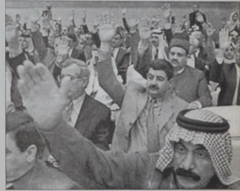
Իրաքի երեսփոխանները դեմ կը քուէարկեն ՄԱԿի Ապահովութեան Խորհուրդի բանաձեւին

Իրաքի խորհրդարանը միաձայնութեամբ մերժեց ընդունիլ ՄԱԿի Ապահովութեան խորհուրդի թիւ 1441 բանաձեւը: Խորհրդարանին 250 պատգամաւորները միաձայնութեամբ որոշեցին չընդունիլ բանաձեւը, զոր պատեւազանի մը նախապատրաստական քայլը նկատեցին: Երեսփոխանները յայտարարեցին սակայն, որ վերջնական որոշումը կու տայ նախագահ Սատտամ Հիւսէյն եւ Յեղափոխական Հրամանատարութեան խորհուրդը: