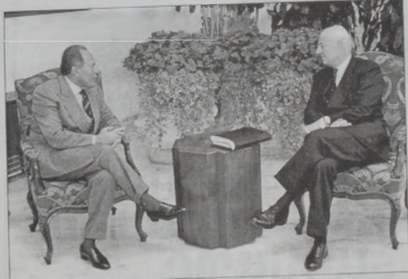
Զօր. Լահուտ ՄԱԿի ընդհանուր քարտուղարի Գերկայացուցիչ Սթեֆան տը Միսթուրայի հետ քննարկեց շրջանային քաղաքական բեմը յուզող հարցերը

խաղներուն՝ խիղճով իշխելու եւ նեցուկ կանգնելու օրէնքին՝ որեւէ որոշում տալու պարագայի. ինչպէս նաեւ՝ քայլ պահելու քարաւաճման եւ արդիականութեան հոլովոյթին հետ: