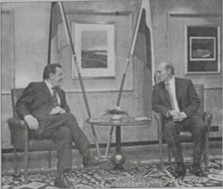
Փութին կը տեսակցի Շրէտսըրի հետ

Ռուսիոյ նախագահ Վլադիմիր Փութին երկ անտեսած է Չեչենիոյ տագնապին խաղաղօրէն վերջ տալու ձեռնարկը և մասին երրորդական խորհուրդները՝ յայտնելով, որ անհկապ տեղ է լուծուի միմիայն ուս եւ չեչէն ժողովուրդին կողմէ: