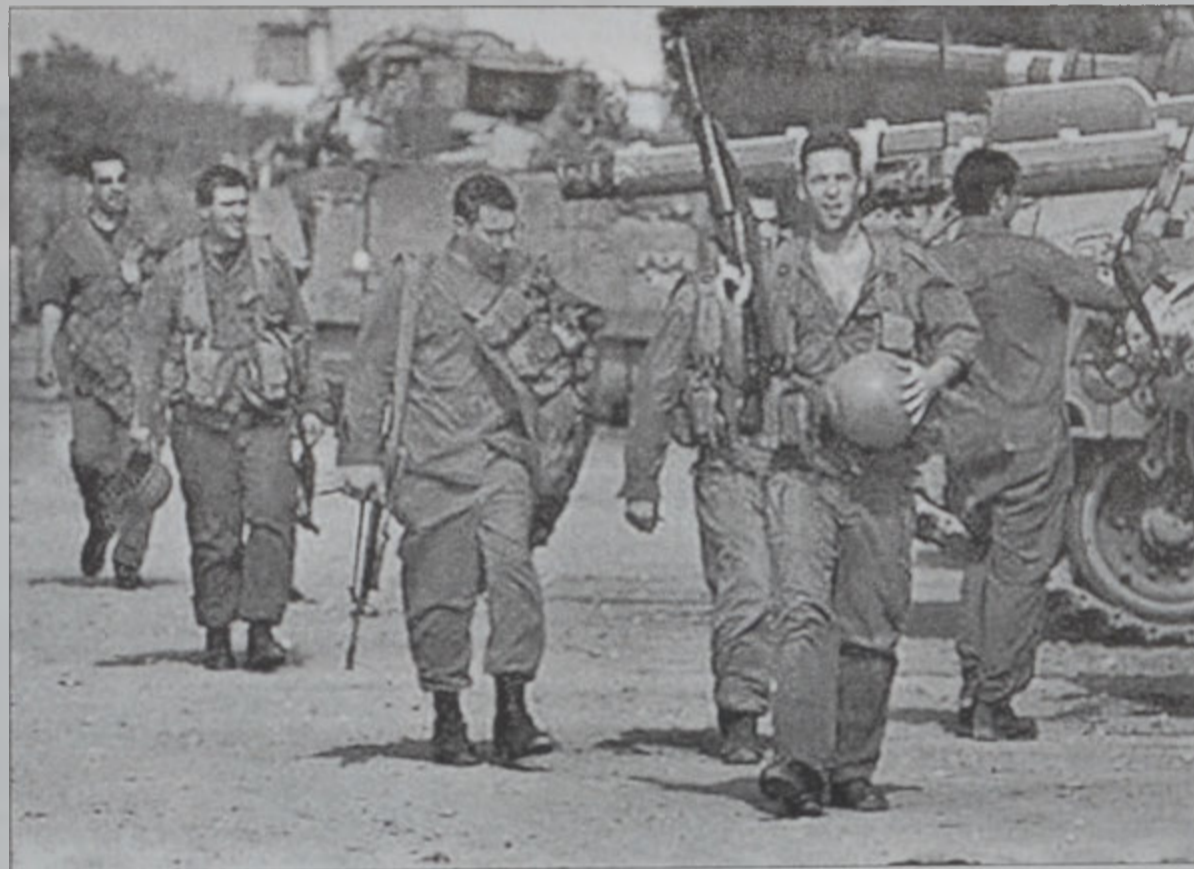
Իսրայէլացի զինուորները գործոց կը վերադառնան Թուրքարմի եւ Նապուսի մէջ իրենց գործած ոճիրներէն ետք

Պաղեստինեան իշխանութեան նախագահ Եասէր Արաֆատ յայտարարեց, որ պաղեստինցիները սկզբնական համաձայնութիւն մը տալու պատրաստ են խաղաղութեան քարտէսին, որ կը