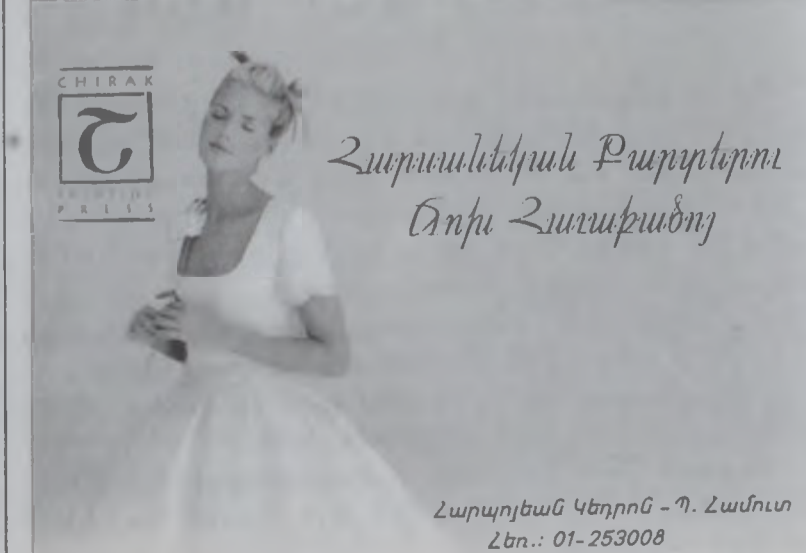
Հարսանեկան Կեդրոն - Ղ. Շամուտ 2 եր. - 01-253008