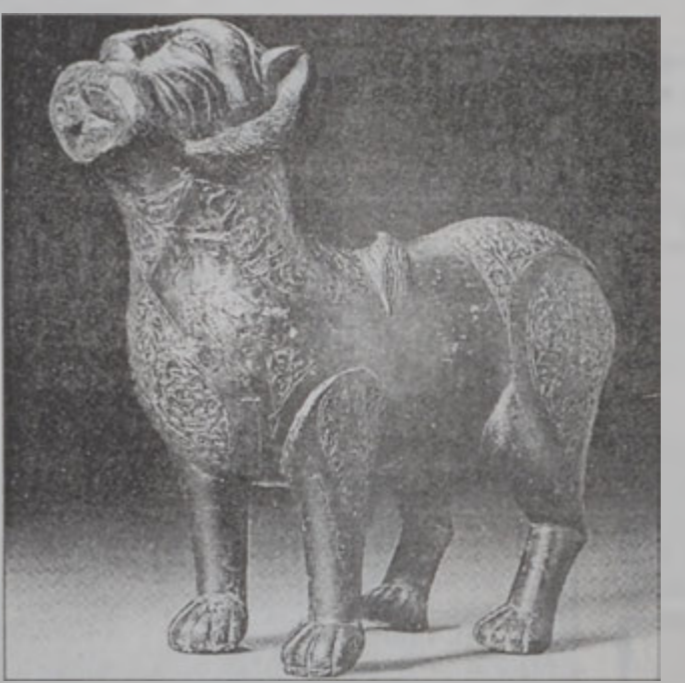
Առիւծի արձանիկ մը վաճառուեցաւ 1,54 միլիոն փաունտի եւ կտրուց մրցանիշ մը

Ճանաչողութիւնը եւ տեսողական ըմբռնումի կայունութիւնը բոլորովին տարբեր անդրադարձներ կ'ունենան: Ասիկա ակներեւ էր Քրիսթի'զ վաճառատան կողմէ յաջողութեամբ վաճառուած 16րդ եւ 17րդ դարերու օսմանեան խեցեղէն հաւաքածոյի մը պարագային, որ կը պատկանէր Նիւ Եորքի մէջ Լուի Պաուէնի կայուածին: Յայտնի չէ, թէ օսմանեան բազմազգեան ընկերութեան մէջ ո՞ր բրուտագործները շինած են գանոնք, սակայն հնա-