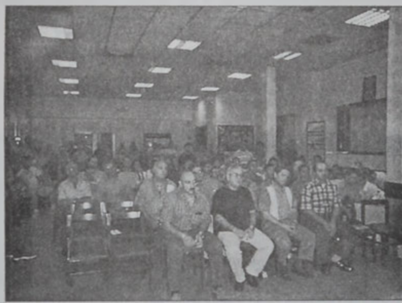
Ներկայ համակիրներէն մաս մը

ճիշդ օր մը առաջ, նկատուեցաւ, որ աչտօր տեղի կ'ունենայ Ա. հանգրուանի բացման մրցումը՝ Հ.Մ.Ը.Մ.ի եւ Հըրրիէ Մաթոյայ Այնճարի միջեւ: Մրցումը տեղի կ'ունենայ Պուրճ Համուտի Քաղաքացիական դաշտին վրայ, ժամը 2:30ին: