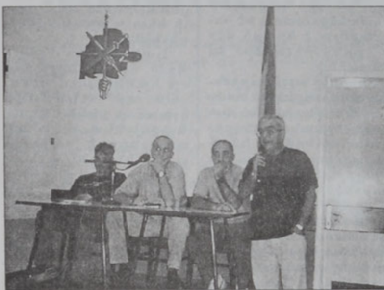
Ֆուլթայոլի յանձնախումբը կը պատասխանէ համակիրներուն հարցումներուն

Այս զրոյց - հանդիպումը տեղի ունեցաւ Լիրանահի ֆուլթայոլի Բ. դասակարգի ախոյեանութեան 2002-2003 եղանակի բացման մրցումէն