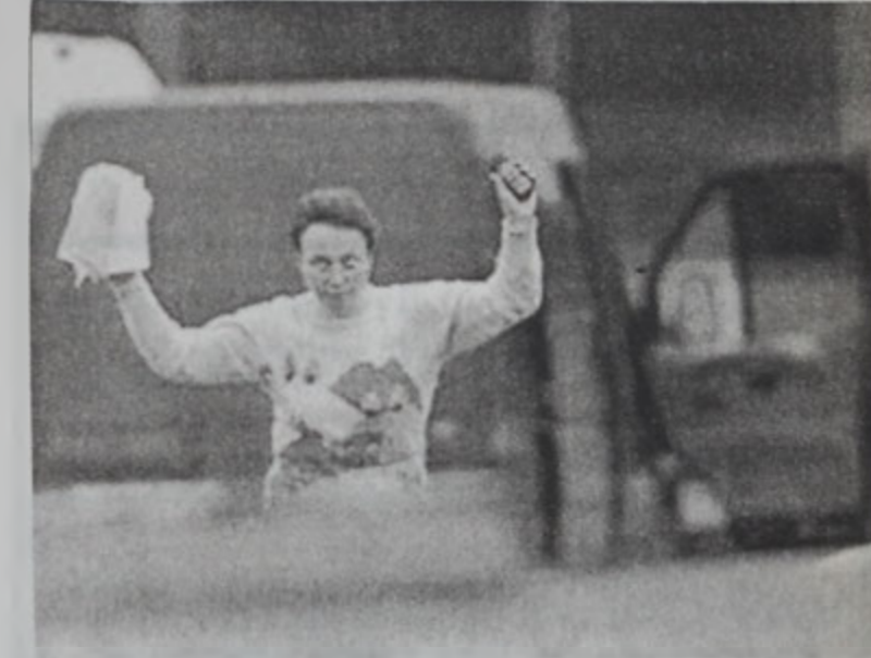
Արձակուած պատանդ կիցը՝ իբրեւ «պատգամաբեր»

Իլիւմ Ալիե ամերիկացի պաշտօնատարներուն ներկայացուցած է Լեռնային Ղարաբաղի տագնապի լուծման գործընթացը: