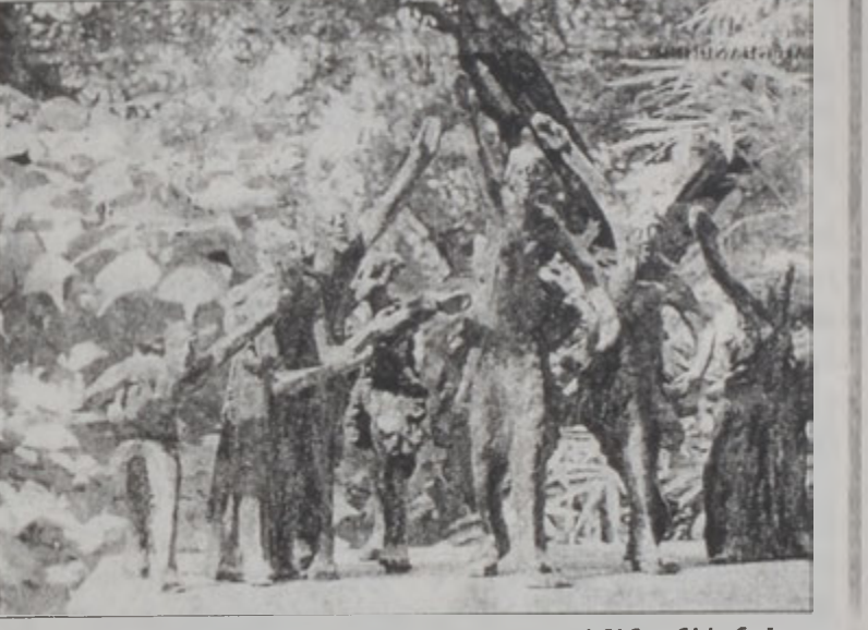
Անթուան Պրոպերիի գործերուն ցուցադրութենէն անկիւն մը

Անթուան Պրոպերիի շուրջ երկու տասնեակ արուստի քանակները կը պարտաւոր սեղաններն ու անկիւնները Պէրոյի ժամանակէ թաղամասին ծայրամասը գտնուող... Քէյարան «Փոլ»ին: Այս նշանաւոր թէյարանը քանի մը օրէ ի վեր իր իմաստներէն ներս կողքին տեղ կը յատկացնէ նաեւ արուստի եւ այս պարագային՝ փոքր եւ միջակ չափի արուստի «անձաւորութիւններու»: Խորտուրորտ մակերեսով այս քանակները ունին գեղագիտական արտայայտիչ դիմագիծ եւ կ'արտայայտեն թեքնիք աշխատանքի վարչետուրիւն: Կանաչաւուն, դեղնաւուն կամ սեւ գոյններով այս քանակները կը ներկայացնեն նուագախումբ: - Լիթանցիի ազգային սիմֆոնիկ նուագախումբի ելույթը, ղեկավարութեամբ՝ Ալեք Փարիի, երեկոյեան ժամը 8:30ին, Սէն ժոզէֆ եկեղեցույ մէջ: - Յուլիանցիի «Մեգոն տիւ վերթիւ», ԱԳԻ Թատրոնի կը ներկայացնէ իր գեղանկարները ու արուստի գեղարուեստը, «Եսպաս Ս. Տաղեր»ի մէջ, ժամը 8:30: - Գարեջուրի փառատոն «Օթթոյլը Քեֆ», Մարտի պանդոկի մէջ, մինչեւ 27 Հոկտեմբեր: - Քանդակագործ Ջաւէն Խաչատուրեանի եւ զեղանկարչուհի Սիրվարդ Ֆազլեանի գործերուն ներկայացումը, Քիւրթի թատրոնի մէջ, մինչեւ 25 Հոկտեմբեր: - «Տիւրքիա օրտ Ֆրէնչ էնտ լեպրիկ թեթոթլալ», Նալպանտեան նուագախումբ, մինչեւ 26 Հոկտեմբեր: