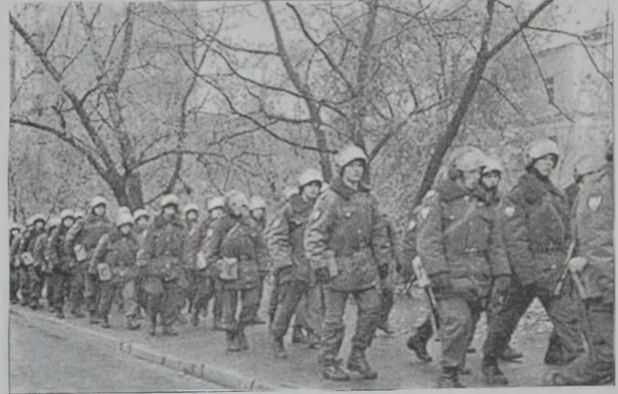
Թատրոնին շուրջ՝ ռուսական յատուկ ուժեր

Ռուսիոյ նախագահ Վլադիմիր Փոլոսին երէկ օդին մէջ կրակելու «Չեչենիոյ մէջ կատարուող հարիւրաւոր պատանդներու ապահովութիւնը իր զլխաւոր նպատակն է, յարձակումները համար ամբաստանելով «այդ նոյն ոճրագործները, որոնք մահ եւ քանդում սփռած են» Չեչենիոյ մէջ: Նախագահը նաեւ յայտնած է, որ յարձակումը արտասահմանի մէջ ծրարուած է: