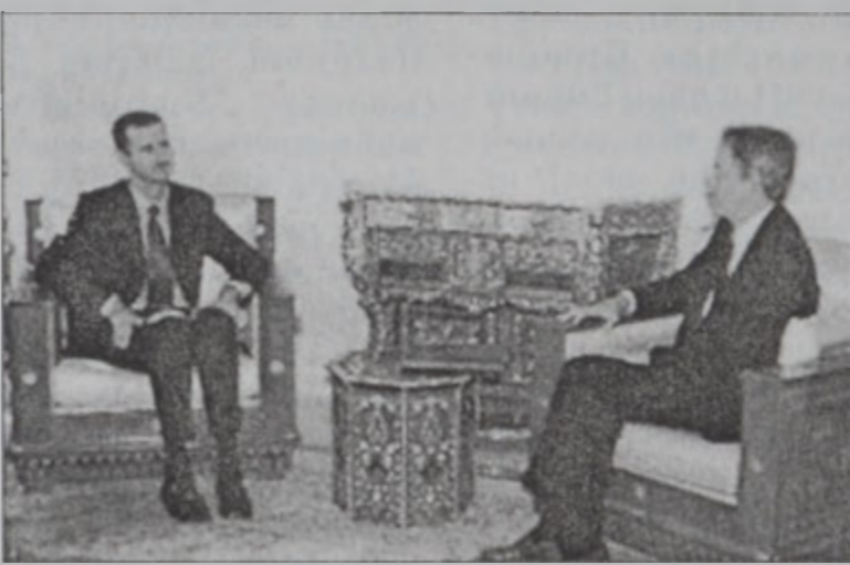
Ասատ կ'ընդունի Պրընցը

բայց եւեւնայպէս անհրաժեշտ կը նկատէ արագ ու խիստ հակադարձութիւն մըն ալ: Իսրայէլի կառավարութեան այլ աղբիւր մը յայտնեց, որ անձնապանական գործողութեան լոյսին տակ հաւանաբար վերատեսուցութեան պիտի ենթարկուի իսրայէլեան ուժերը Հեպոնի կարգ մը թաղամասերէն հեռացնելու ծրագիրը,