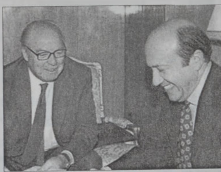
Պիլքս՝ Ռուսիոյ արտաքին գործոց նախարար Իկոր Իվանովի մօտ

Ուաշինկթընի նորագոյն ձեւը, սակայն, խիստ քննադատութեան ենթարկուեցաւ Ռուսիոյ եւ Թուրքիոյ կողմէ: «Ինքըրֆաքս» լրատու գործակալութիւնը հաղորդեց, որ նոր բանաձեւը յուսալարութիւն պատճառած է Ռուսիոյ, որ նկատած է, թէ առաջարկուած բանաձեւը չի տարբերի րոտաչիւն առաջարկէն, որ մերժուած էր Մոսկուայի եւ Ապահովութեան խորհուրդի այլ անդամներու կողմէ: Ուաշինկթընի դաշնակից Թուրքիա եւս քննադատեց Միացեալ Նահանգները, զիտեղ տալով, որ անոնք հակասական