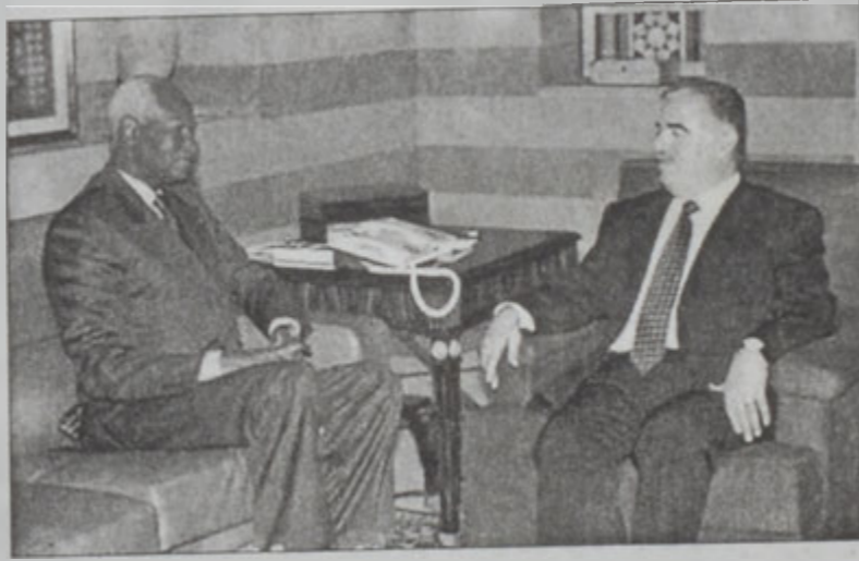
Վարչապետը կ'ընդունի Տիուֆը

Վարչապետ Ռաֆիկ Շարիրի յառաջիկայ շաբաթավերջին պիտի սկսի երկօրեայ շրջապտույտ մը, որուն ընթացքին պիտի այցելէ Ծոցի երկիրներ՝ քննարկելու համար տնտեսութեան յատուկ «Փարիզ - 2» վեհաժողովի նախապատրաստական աշխատանքները, ինչպէս նաեւ շրջանային եւ միջազգային հարցեր: