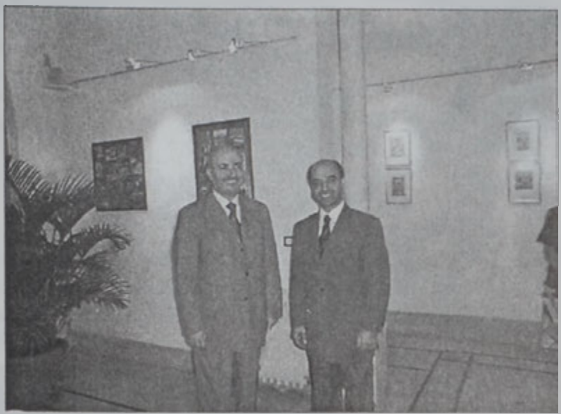
Արիտի եւ Վեր. Հայտնութեան

Երէկ, Երեքշաբթի 22 Հոկտեմբերին, Հայկական համալսարանին մէջ տեղի ունեցաւ ընդունելութիւն մը՝ ի պատիւ լրագրողներուն, ներկայութեամբ տեղեկատուութեան նախարար Ղազի Արիտիի: Հանդիպումին բացման խօսքը կատարեց Լուսինա Սերոբեան, որ բարի գալուստ մաղթեց լրագրողներուն եւ յոյս յայտնեց, որ անոնց եւ համալսարանին միջեւ գործակցութիւնը շարունակուի եւ պարգանալ: Ապա խօսք առաւ համալսարանի տնօրէնը՝ վեր. Փոյ Հայտնութեան, որ անդրադարձաւ լրագրողներուն եւ մասնակցի անհրաժեշտութեան: Ան ըսաւ, թէ տեղեկատուութիւնը ինքնին դպրոց մըն է, որուն դասաւանդութիւնները կ'երկարին ամբողջ կենսոյթի մը վրայ: Տեղեկատուութեան նախարար Ղազի Արիտի, ցաւ յայտնեց շատ քիչ թիւով լրագրողներու ներկայութեան համար: Ան բոլորին անունով շնորհակալութիւն յայտնեց համալսարանին՝ իր այս նախաձեռնութեան համար: Նախարար Արիտի նշեց, թէ լրագրողները աշխատանք կը տանին այսօր, որպէսզի վաղուան սերունդին համար աւանդ մը ձգեն եւ պատմութեան կերտման համար օժանդակեն: Ան ըսաւ, թէ տեղեկատուութիւնն ու համալսարանը անուղղակի կապ մը ունին իրարու հետ, որովհետեւ երկուքն ալ կը միտին գիտութիւն ջանքելու եւ տեղեկութիւններ փոխանցելու: