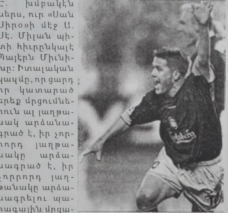
Մայքըլ Օուրը, որ հէթըրը մը իրագործեց

«Չէմփիընս Լիկ»ի Ա. հանգրուանի դարձի մրցումներուն, երէկ Ա. խմբակին պարագլուխի դիրքը գրաւող Արսենալ, որ ցարհիր կատարած երեք մրցումներուն ալ յաղթանակներ արձանագրած էր՝ առանց կողստանալու իր բերդէն ներս, կրեց մրցաշարքի իր առաջին պարտութիւնը, իր դաշտին՝ «Հայլըրի»ի մէջ, իր հիւրին՝ Օքսֆորտ, 2 - 1 արդիւնքով՝ Օլիվիէ Քափո (8րդ) եւ Խալիլու Ֆատիկա (28րդ) նշանակեցին Օքսֆորտի կողերը, իսկ Նվանքով Քանու՝ Արսենալի կողերը (53րդ): Նշենք, թէ Օքսֆորտ կ'արձանագրէր մրցաշարքի իր առաջին յաղթանակը: