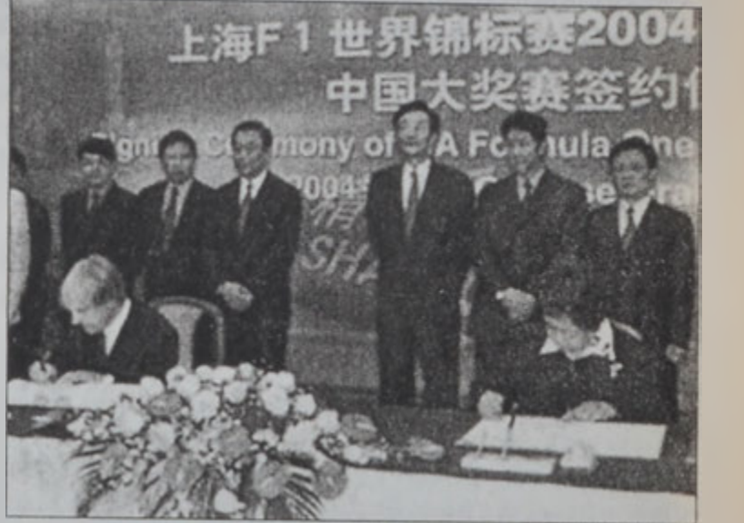
Պեռնի Էլբերտը (ձախից) կը ստորագրէ պայմանագրութիւնը

Ֆորմուլա 1ի նախագահը՝ Պեռնի Էլբերտը երէկ յայտնեց, թէ ներկայի 17 կրան փրիմերէն մէկը 2004էն սկսեալ դուրս պիտի մնայ յայտագրին, որովհետեւ 2004ին Շանհայ ինք պիտի ըլլայ կրան փրի մը հիւրընկալողը: Շաբթուակիցին, Էլբերտը Չինաստանի հետ ստորագրեց պայմանագրութիւն մը, ըստ որուն՝ անիկա առաջին անգամ ըլլալով պիտի հիւրընկալէ կրան փրի մը՝ 2004էն 2010: