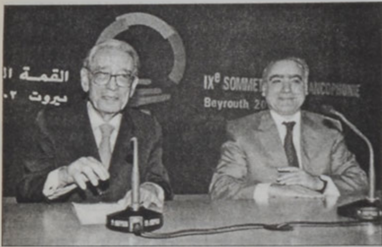
Ղալի եւ Սալամէ՝ մամլոյ ասուլիսի ընթացքին

Նախարար Յովնանեան նշեց օրինակներ՝ երիտասարդութեան կողմէ կատարուած աշխատանքներու եւ վեհաժողովներու: