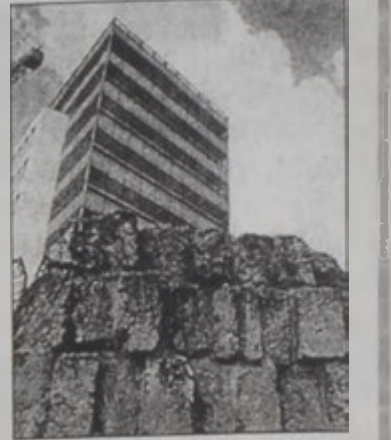
Ցուցադրութեան դրուած լուսանկարներու մէջ. հին եւ նոր քաղաքի կառոյցներ՝ Պէյրուսի մէջ

Լիբանանցի եւ ֆրանսացի տասնհինգ ուսանողներու գործընդերս կայացող լուսանկարչական ցուցահանդէսը տեղի կ'ունենայ Ֆրանսական Մշակութային կենտրոնին մէջ: «Պէյրուս, իջեալ սիւփերփոփ» («Պէյրուս, ժամանակի խաւերուն ընդմէջ») խորագրեալ այս ցուցահանդէսը կը ներկայացնէ Պէյրուսի անցեալն ու ներկան շարկապող լուսանկարներ, որոնք գործերն են Լիբանանի ԱՊՍ Ակադեմիայի եւ Ֆրանսայի Լուի Լիւմիէր Ազգային Բարձրագոյն Ակադեմիայի շրջապատում լուսանկարչական ցուցահանդէսներու: 2002ի Փետրուարէն մինչեւ Ապրիլ տեւած անոնց աշխատանքին հսկած են լիբանանցի եւ ֆրանսացի մասնագէտներ: Դարաշրջաններու ընդմէջէն Պէյրուսի պատմութիւնը պատմող այս լուսանկարները կը ներկայացնեն քաղաքին նախաքրիստոնէական ժամանակներէն մնացած անկարներ եւ հողի ընդերքէն յայտնաբերուող հնութիւններ, որոնց նախկին կամ հորիզոնին վրայ կը բարձրանան բարձրաշարժ շէնքեր: Եկեղեցիներու, հին կառոյցներու եւ բաղնիքներու, փողոցներու, հրապարակներու, պալատներու եւ սիւներու նկարներով քաղաքին հնադարեայ ու ժամանակակից պատմութիւնը կը տողանցէ ցուցադրուող