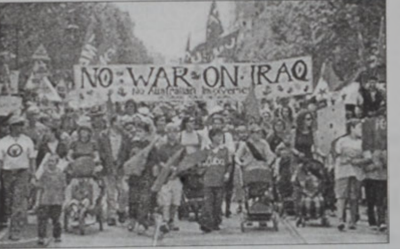
Աւստրալիոյ մէջ հակամերիկեան ցոյց՝ բազմահազար աւստրալիացիներու մասնակցութեամբ

մէջ սակայն, Սատտի պի-ղեցաւ իրաքցիներու հետ Տարածաշրջանի կատա-րելու պահանջին, ինչ-պէս նաեւ՝ իրաքեան օդային սահմաններուն մէջ թռիչք կատարելու: Ապահովութեան նոր-հուրդի արեւմուտքի մէկ դիւանագէտը ըսաւ, որ իրաք տակաւին «այո», կամ «ոչ» պա-տասխան չէ տուած քննիչներուն մասին: Դիւանագէտը աւելցուց, որ իրաք կը խուսափի ուղղակի պատասխան մը տալէ: Միւս կողմէ, Պաղես-տի մէջ կայացած կրօնա-կան ժողով մը, որուն մասնակցեցան մօտաու-րապէս հինգ հարիւր իրաքցի իսլամ կրօնաւոր-ներ եւ մտաւորականներ, կարծի ու անգիջող ռա-նաձեւով մը եզրափակ-ուեցաւ: Ժողովը հրա-պարակեց իր անհրաժեշտ-ները, որ աշխարհի տարած-քին գտնուող իսլամներ-ը կը պահանջէ պատե-րազմ յայտարարել Միացեալ Նահանգներուն զէմ, եթէ անոնք յարձա-կուած գործեն իրաքի վրայ: Ժողովի աւարտին հրապարակուած յայտա-արարութիւնը կը նշէր, որ իրաքի վրայ յարձակումի մը պարագային, ամէն իսլամ պարտաւոր է ի-կաւ յայտարարելու ամե-րիկեան շարժման վար-