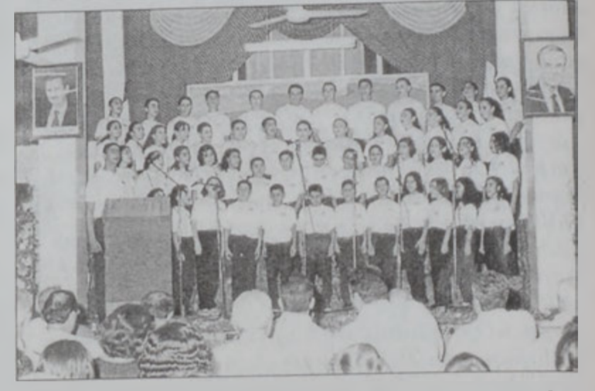
Պատանեկան երգչախումբը՝ ելոյթի պահուն

Կիրակի, 21 Սեպտեմբերին, Գամիչիի Ջաւարեան Պատանեկան Միութիւնը շրջանի «Խորհրդանուն» սրահին մէջ նշեց Հայաստանի անկախութեան վերականգնման 11ամեակն ու «Պատանի Օր»ը: Ներկայ էին ազգային իշխանութեան ու միութիւններու ներկայացուցիչներ եւ հոծ բազմութիւն մը: