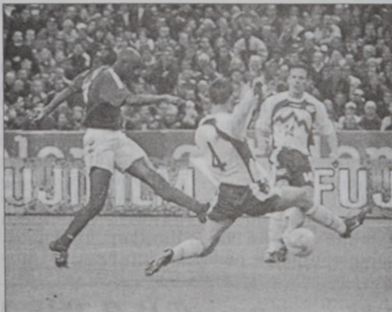
Փաթրիք Վիերա (ձախից), որ կը ճշանակէ Ֆրանսայի եւ մրցումին առաջին կոլը

«Փարք տը Փրէնս»ի մէջ տեղի ունեցած մրցումին, որուն ներկայ էր շուրջ 78 հազար համակիր, դաշտին տէրերը 5 - 0 արդիւնքով պարտութեան մատնելէ ետք իրենց հիրը՝ Սլովենիան, գրաւեցին Ա. խմբակին պարագր-լուիսի դիրքը: Ֆրանսայի հինգ անպատասխան կոլերը նշանակեցին՝ Փաթրիք Վիէրա (10րդ), Սթիւ Մարլէ (35րդ եւ 65րդ), Սիլվէն Ռիլթորտ (79րդ) եւ Սիտնի Կոլմո (87րդ): Մրցումը ամէնէն աւելի անոտանայի