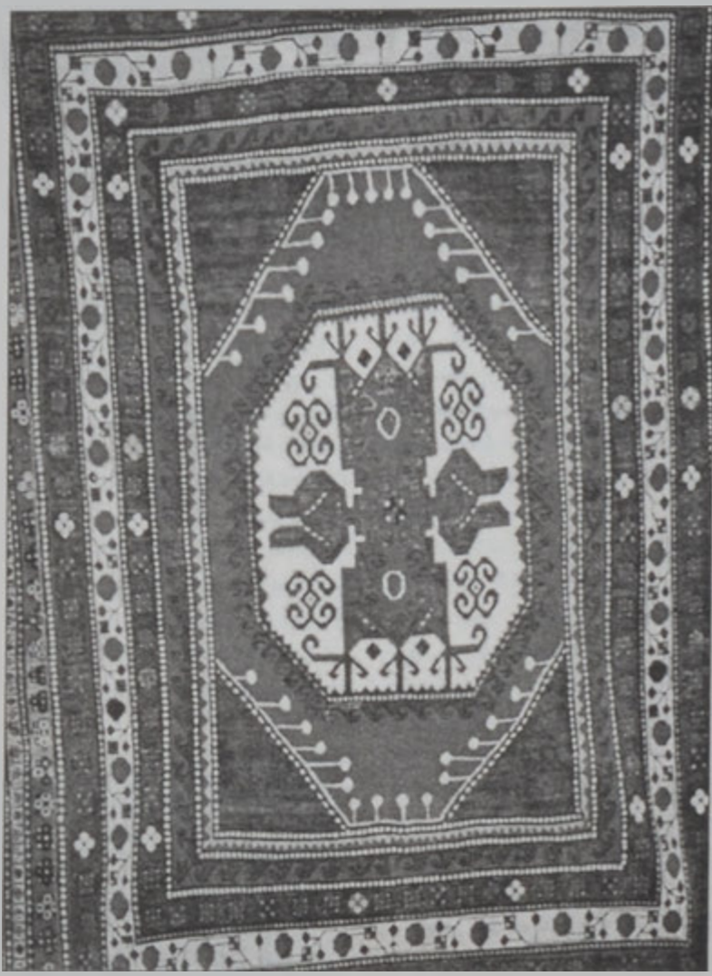
Հայկական գորգի «Լոռի բանպակ» տեսակի ուշագրաւ մոնու ծր:

Հովանաւորութեամբ Լիբանանի մէջ Հայաստանի դեսպան Արեգ Յովհաննիսեանի, Հինգշաբթի, 3 Հոկտեմբերի երեկոյեան ժամը 7:00ին տեղի ունեցաւ բացումը Հայկական ժամանակակից գորգերու ուշագրաւ ցուցահանդէսի մը, Լուսինի 4. Նայպաստեան ցուցասրահին մէջ (Սոսիս, էշրեֆիէ): Յուշագրութեան դրուած էին Հայկական գորգերու 20 տարբեր տեսակի նմուշներ, որոնք այնքան գեղեցիկ էին, որ հին եւ որակեալ գորգերու տպաւորութիւն կը ձգէին ակնդիրներուն վրայ: