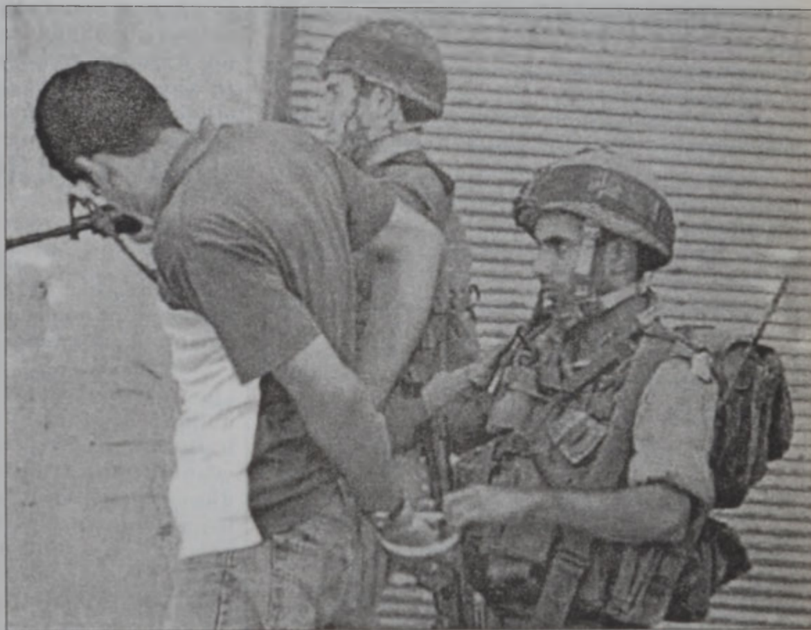
Իսրայէլացի զինուորներ կը ձերբակալեն պաղեստինցի երիտասարդ մը Նապուսի մէջ

Զորս պաղեստինցիներ սպաննուեցան եւ աւելի քան երեսուն ուրիշներ վիրաւորուեցան երէկ Կազայի մէջ, երբ իսրա-վէլեան ուժեր ներխուժե-ցին խճողուած գաղթա-կայան մը, ուր բնակա-րաններ քանդեցին: Բա-նակը յայտնեց, որ քան-դած է երկու բնակարան-ներ, որոնք կառուցուած էին զէնքի մաքսանեն-դութեան համար օգտա-գործող ստորերկրայ փապուղիներու վրայ: Պաղեստինցի ականա-տեսներ յայտնեցին սա-կայն, որ երկու բնակա-րաններուն ուժարհարու-մը այնքան ուժեղ էր, որ անոնց մօտակայ այլ բնակարաններ քան-դուեցան՝ սպաննելով երեք տարեկան մանուկ մը: Փլած բնակարաննե-րուն մէջ վիրաւորուած են քսանհինգ պաղես-տինցիներ: Ականատես-ներ յայտնեցին նաեւ որ ՌաֆաԿ Գաղթակայանին մէջ իսրայէլեան ուժե-րուն արձակած փամ-փուռներէն սպան- յար. Էջ 2