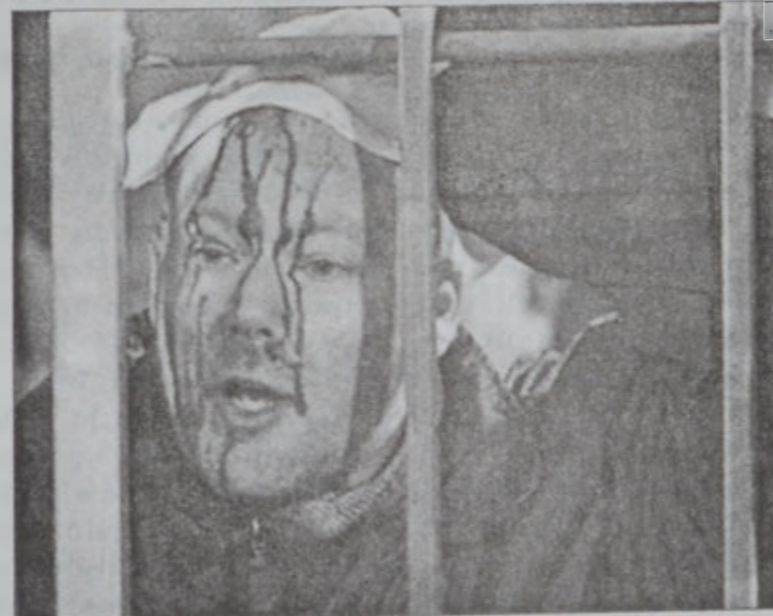
Վիրաւոր անգլիացի համակիր մը արիւնուայ վիճակի մէջ

րագուայի դիրքը: Վարագուայի մէջ տեղի ունեցած մրցումին, հիւր կազմը իր կոլը նշանակեց 30րդ վայրկեանին: Սթոքհոլմի մէջ, Շուէտ դժուարութեամբ 1 - 1 արդիւնքով հաւասարութիւն մը արձանագրեց իր հիրին՝ Հունգարիոյ հետ, երբ