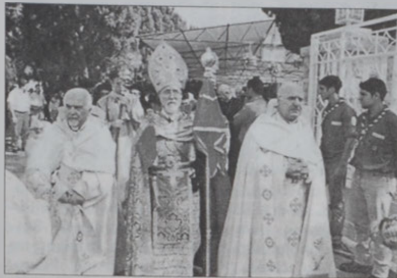
Թարմունի պատրիարք կ'առաջնորդէ թափօրը Լուսակարը՝ ՍԹԻՆՏԻՕ ԱՇԼԱԿԻ

Մէկուկէս միլիոն հայ նահատակներուն հետ Հայկական Յեղապայանութեան զոհ զացած Չմմառու միաբան իգնատիոս արք. Մարոյեանի երանացման առաջին տարեդարձին առիթով, երէկ, Չմմառու վանքին հրապարակին վրայ մատուցուեցաւ Ս. պատարագ Ներսէս Պետրոս ԺԹ. Թարմունի պատրիարքին կողմէ եւ որուն ընթացքին օրուան պատգամը փոխանցեց մարմններու Նասարալլա Պութրոս ՍՖէյր պատրիարքը: