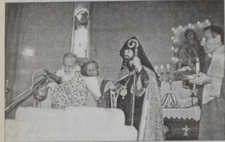
Եկեղեցւոյ անկիւնքարերու լուացում եւ օրհնութիւն

Հինգշաբթի, 15 Օգոստոսին, Պուրճ Համուտի Ազգային Առաջնորդարանին մէջ, Ազգային Իշխանութեան եւ «Ապուստ Ապու Էլիաս» շինարարական հաստատութեան միջեւ կնքուեցաւ պայմանագրութիւն՝ քարայտերու համար Ս. Վարդանանց եկեղեցւոյ արտաքին երեսը: Կիրակի, 6 Հոկտեմբերին, յընթաց Ս. պատարագի եւ ձեռամբ Լիրանանի հայոց թեմի առաջնորդ ինքնին եպս. Բարդուղիմէոսի կողմէն կնքուեցաւ Սրբոց Վարդանանց եկեղեցի: Հետագային շրջանին մէջ սկսած շինարարական լայնածիր գործունէութիւնը եկեղեցւոյ եւ Ազգային Նուպարեան վարժարանին շէնքերը վտանգաւոր վիճակի հասցուցած ըլլալով, հարկ եղաւ նորերը կառուցել: