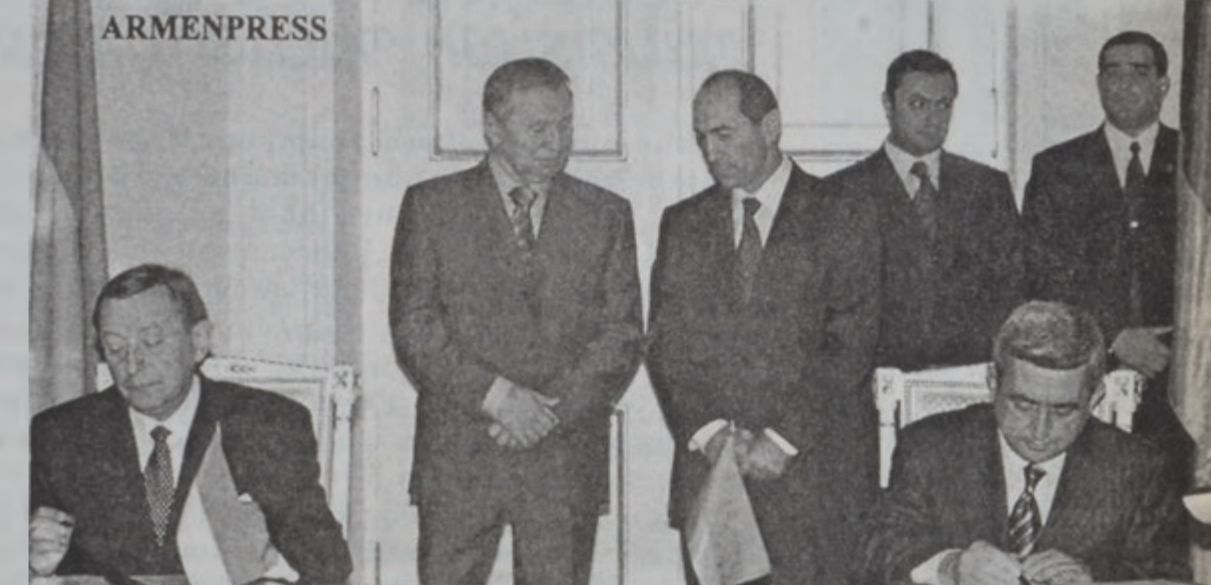
Նախագահներ Զոհարեանի եւ Զուլմայի Գերկայութեան կը ստորագրուի պաշտպանութեան մարզի վերաբերեալ համաձայնագիրը

Հայաստանի նախագահ Ռոպէրթ Քոչարեան երէկ ընդունեց Ուրբանիոյ նախագահ Լէոնիա Քուլչմայի, որ պաշտօնական այցելութեան մը համար 9 Հոկտեմբերին հաստատանի նախագահի նստավայրին մէջ տեղի ունեցաւ ընդունելութեան արարողութիւն, որուն յաջորդեցին հայ-ուրբանական բարձր մակարդակի բանակցութիւններ, նախագահներ Քոչարեանի եւ Քուլչմայի միջեւ: Երկու նախագահները քննարկեցին հայ-ուրբանական յարաբերութիւններու ներկայ իրավիճակը եւ զարգացման հեռանկարները: Անոնք ընդգծեցին, որ բարեկամական կապերու հետագայ ամրագրումը եւ Հայաստանի ու Ուրբանիոյ միջեւ բարձրագոյն մակարդակի համագործակցութիւնը կը ծառայեն երկու ժողովուրդներու շահերուն: Քուլչմայի զործակցութեան ու Քոչարեանի հետ ընդունելութեան մը մըն է երկկողմանի յարակիցութիւններուն մէջ: Կողմերը հայեւորեան կան կապերու կարեւոր բաղադրիչներն են համա-