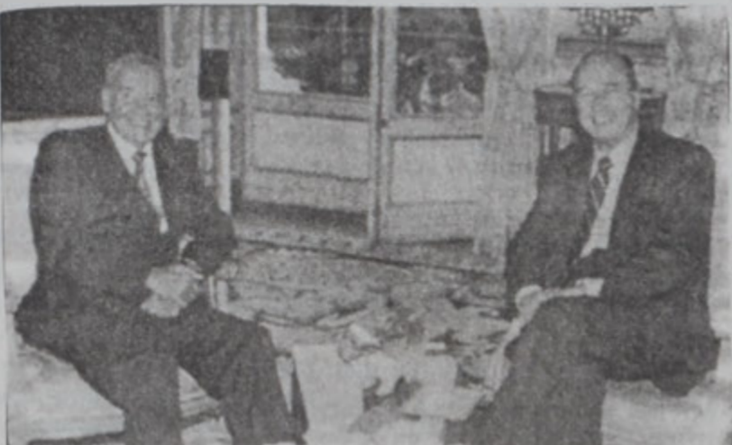
Պերրի՝ Էլիզեի պալատից մէջ, Շիրաքի կողքից

Խորհրդարանի նախագահ Նեպոլիտէ Պերրի, որ պաշտօնական այցելութեամբ կը գտնուի Ֆրանսա, երէկ կատարեց պաշտօնական յայտարարութիւն մը, որուն մէջ հաւաստեց, թէ Ուազգանիի ջուրերը օգտագործելու Լիբանանի իրաւունքները անվիճելի են, «իսկ որովհետեւ Իւրաքայլ կը շարունակէ այս հարցը արծարծել՝ Լիբանան ՄԱԿէն պահանջեց նաեւ ջուրերու սահման մը ճշդել՝ «Կապոյտ Գիծ»ին նման», ըսաւ ան: Պերրի յայտնեց նաեւ, որ իր այցելութեան ընթացքին քննարկած է ընդհանուր հարցեր, Լիբանանի անուսով շնորհակալութիւն յայտնած է Ֆրանսայի, որ օժանդակեց Ֆրանսասիոյ շնորհներու վեհաժողովը Լիբանանի մէջ կայացնելու: