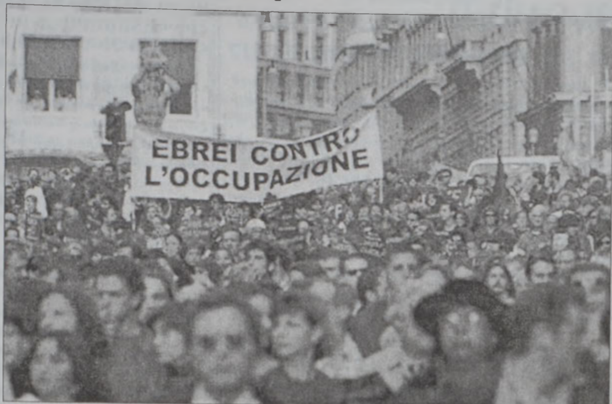
Բողոքի ցույցեր՝ Իտալիոյ մէջ

րաւեր ուղղելով ամբողջ աշխարհին, պատերազմը անխուսափելի պիտի դառնայ: Ուաշինգթոն կը մերժէ քննիչներուն Իրաք վերադարձը, մինչեւ որ ՄԱԿի Ապահովութեան խորհուրդը նոր ու աւելի խիստ որոշում մը չորդեգրէ Իրաքի հանդէպ: Ուաշինգթոն կը պահանջէ, որ Ապահովութեան խորհուրդի բանաձեւը լիազօրէ պիտուրական գործողութիւն մը, եթէ Իրաք չենթարկուի պայմաններուն: Ապահովութեան խորհուրդի մնայուն անդամ Ֆրանսա, Չինաստան եւ Ռուսիա չեն ուզեր ընդառաջել ամերիկեան պահանջին, շեշտելով, որ այս հանգրուանին անհրաժեշտ է քննիչներուն վերադարձը Իրաքէ աշխատանքի ձեռնարկելը: Անոնք կ'ըսեն նաեւ, որ քննիչներուն կատարելիք արժեւորու-