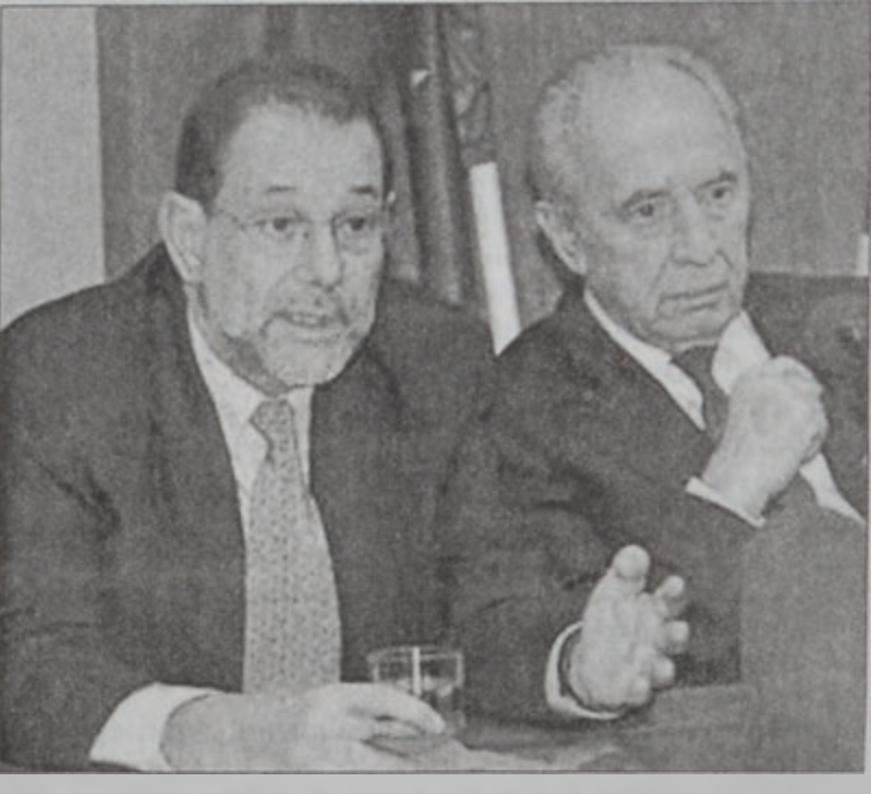
Սոլանա եւ Փերէս

Եւրոպական Միութեան արտաքին քաղաքականութեան պատասխանատուն՝ Նաւիէ Սոլանան, որ միջին արեւելեան շրջապոյտի մը ձեռնարկած է, երէկ Հանդիպումներ ունեցաւ իսրայէլացի ու պաղեստինցի պաշտօնատարներ հետ: Մինչ Այսրյորդանանի մէջ կը շարունակուին բախումները՝ նոր գոհնք պատճառելով: Սոլանան, որ շրջան հասած էր Շարքի օր, յայտնած էր, թէ պաղեստինցիներուն եւ իսրայէլացիներուն հետ Հանդիպումներուն ընթացքին պիտի շեշտէ կարեւորութիւնը բանակցութիւններուն վերսկսելու: Անոր այցելութեան նպատակներէն է նաեւ ճամբայ հարթել «քառեակ»ին կողմէ առաջարկուած ծրագիրին դիմաց: «Քառեակ»ը կազմուած է Միացեալ Նահանգներէն, Ռուսիայէն, ՄԱԿէն եւ Եւրոպական Միութենէն: